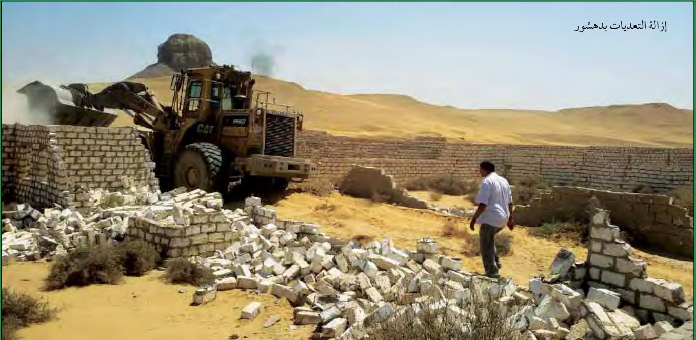
إزالة التعديات بدهشور

• نجحت وزارة الآثار بالتعاون مع وزارة الداخلية والمحافظات بإزالة التعديات علي الأراضي الأثرية بمحافظات مختلفة.