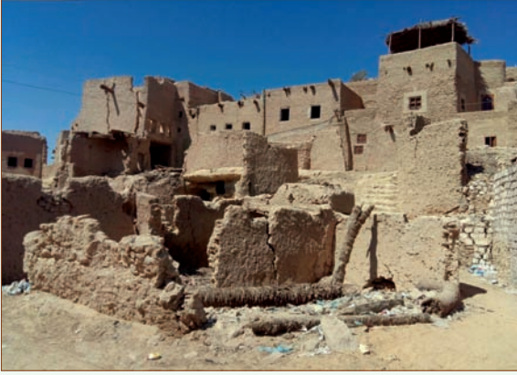
قرية شالي بواحة سيوة