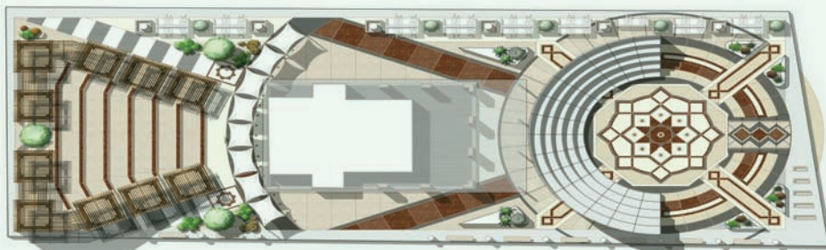
التصميم المقترح للموقع العام لمنطقة بيت القاضي