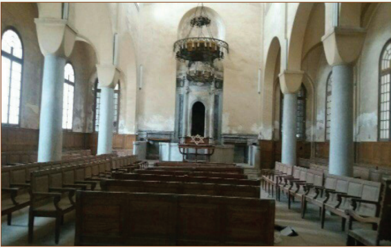
معبد يعقوب منشه بميدان المنشية

أبرز ما تم إقراره في إجتماعات مجلس إدارة المجلس الأعلى للآثار واللجان الدائمة للآثار: