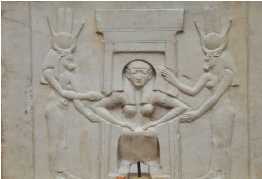
لوحة الولادة التي حصلت على أعلى تصويت واختيرت قطعة الشهر بالمتحف المصري بالتحرير