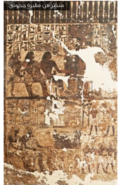
منظر من مقبرة جحوتي