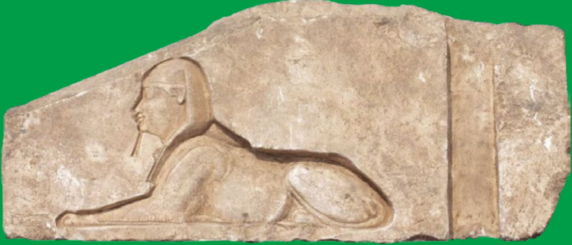
كتلة حجرية - المطرية

* نجحت بعثة جامعة «خيان» الإسبانية بمنطقة مقابر