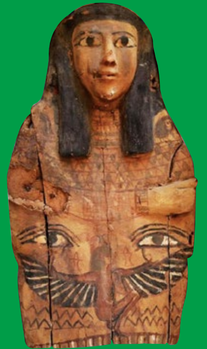
غطاء تابوت عائد من إسرائيل