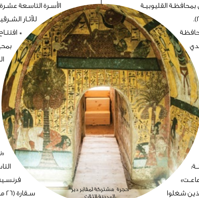
حجرة مشتركة لمقابر دير المدينة الثلاث

* إعادة فتح هرم أوناس (بعد غلقه لما يقرب من ٢٠ عاماً) ومقبرتين من الأسرة السادسة للوزير «عنخ ماحور» و«نفرسشم بتاح» زوج ابنة الملك تتي، وإفتتاح مقبرة «نمتي مس» أحد كبار رجال الدولة بالأسرة التاسعة عشرة (المكتشفة بواسطة بعثة فرنسية برئاسة Dr. Alain Zivie)، وذلك بمنطقة آثار سقارة (٢٦ مايو ٢٠١٦).