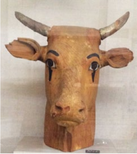
من معرض سيناء مهد الكتابة الأبجدية

* افتتح بالمتحف القبطي المعرض المؤقت تحت عنوان «مصر أمن وأمان»، ويعرض فيه ٤ قطع أثرية عن دخول العائلة المقدسة إلى أرض مصر (١ يونيو حتى ٣١ أغسطس ٢٠١٦).