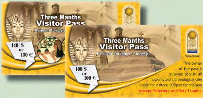
تصريح زيارة موسمي (ثلاثة شهور) للأجانب المقيمين