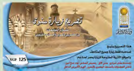
تصريح زيارة سنوي لطلاب الجامعات من المصريين والعرب والأجانب المقيمين