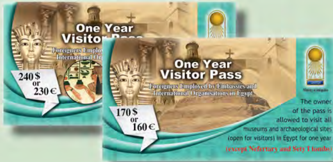
تصريح زيارة سنوي للأجانب العاملين بالسفارات والمنظمات الدولية