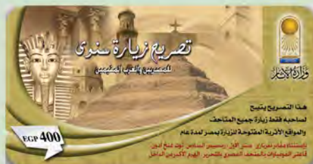
تصريح زيارة سنوي المصريين والعرب المقيمين