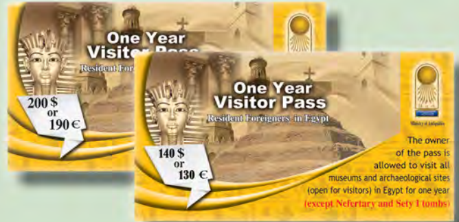
تصريح زيارة سنوي للأجانب المقيمين