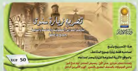
تصريح زيارة سنوي لتلاميذ المرحلة الثانوية بالمدارس الحكومية والخاصة والدولية بمصر