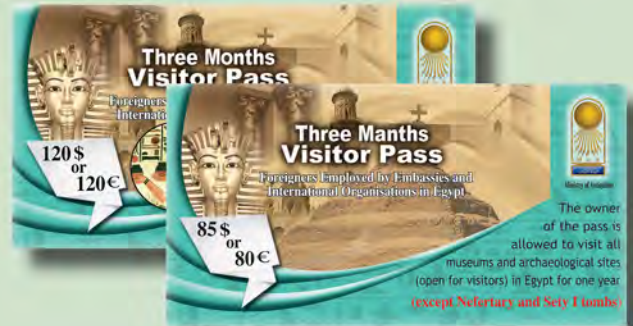
تصريح زيارة موسمي (ثلاثة شهور) للأجانب العاملين بالسفارات والمنظمات الدولية

تصدر التصاريح بأصل بطاقة الرقم القومي أو جواز السفر وصورة شخصية حديثة