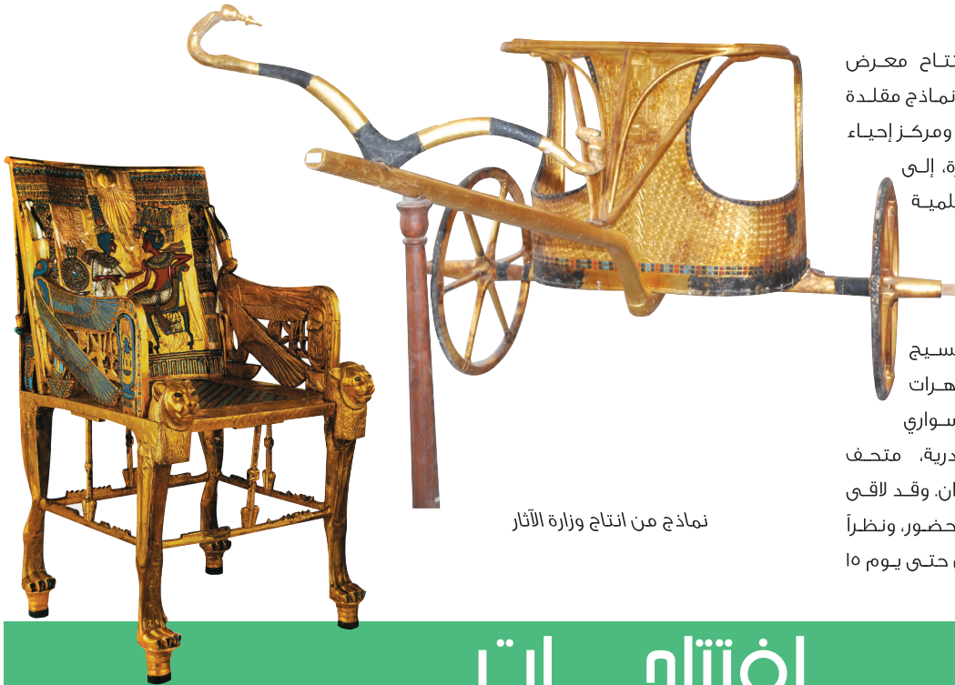
نماذج من إنتاج وزارة الآثار

والجدير بالذكر أن للوزارة منافذ بيع أخرى: متحف مركب خوفو بالجيزة، متحف جابر أندرسون، متحف النسيج بالقاهرة، قلعة رشيد، ومتحف المجوهرات الملكية والمتحف القومي وعمود السواري وكوم الشقافة بمحافظة الإسكندرية، متحف التحنيط بالأقصر ومتحف النوبة بأسوان. وقد لاقى المعرض نجاحاً كبيراً واستحساناً من الحضور، ونظراً للاقبال الشديد تقرر مد فترة المعرض حتى يوم ١٥ أغسطس ٢٠١٦.