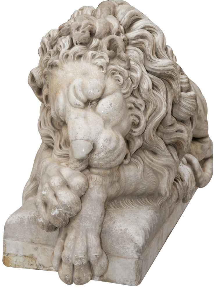
تمثال من الرخام موجود حالياً بفندق الماريوت

ولذلك تم إنشاء إدارة المقتنيات الأثرية لتكون الجهة المنوط بها معاينة الآثار المنقولة وتسجيلها، لدى الأفراد أو الهيئات الحكومية وغير الحكومية وذلك لتسهيل استردادها في حال خروجها من البلاد طبقاً للقوانين والأحكام الدولية التي نصت على استرداد القطع بشرط أن تكون مسجلة في عداد الآثار، وجاء ذلك ضمن مواد القانون الخاص بحماية الآثار رقم ١١٧ لسنة ١٩٨٣، والمعدل بالقوانين أرقام ٣-٦١ لسنة ٢٠١٠ ولائحته التنفيذية رقم ٧١٢ لسنة ٢٠١٠ والذي نص على: «على كل من يمتلك قطعة أثرية غير مسجلة أن يتوجه إلى المجلس الأعلى للآثار لتسجيلها متى تملكها أو علمه