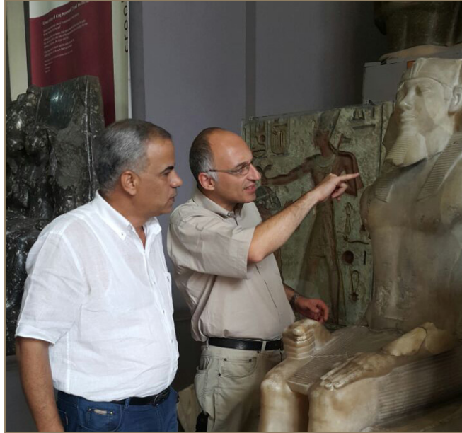
تمثال منكورع الذي نقل إلى المتحف المصري الكبير.

مركب خوفو الثانية: تم رفع العديد من القطع الخشبية من حفرة المركب وترميمها ونقلها للمتحف المصري الكبير بعد أن قام فريق العمل المصري-الياباني بتسجيلها وتوثيقها وتصويرها بتقنية المسح بالليزر، وقد تم رفع ٦٨٥ قطعة خشبية حتى الطبقة السابعة وترميم حوالي ٦٤٥ قطعة منها.