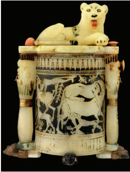
إناء من مجموعة الملك توت عنخ آمون.

• للمرة الأولى منذ عام ٢٠١١ استقبل المسرح الروماني بالإسكندرية عدة حفلات موسيقية وغنائية بالتنسيق مع دار الأوبرا المصرية لإحياء الأماكن التراثية والأثرية وإقامة الأنشطة الثقافية فيها خلال موسم الصيف.