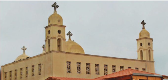
كنيسة أبانوب بمحافظة الغربية