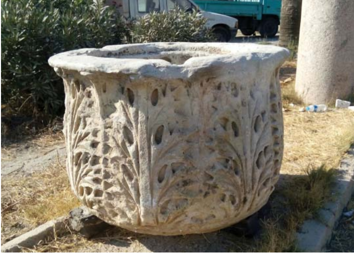
إحدى القطع الأثرية التي تسلمتها الوزارة من القنصلية الأمريكية بالإسكندرية.

• بدأ فريق العمل بالمتحف القبطي نقل محتويات مكتبة المتحف بعد إغلاقها لأكثر من خمسة عشر عاماً، تمهيداً لتجديدها وفتحها للباحثين. وتأتي أهمية المكتبة لما تحتويه من كتب ومخطوطات التاريخ المصري والقبطي التي جمعها مرقس سمكة باشا مؤسس المتحف.