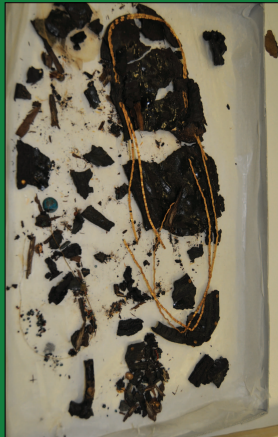
نعل الملك توت عنخ آمون