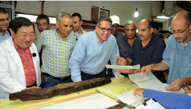
تفقد أعمال مركب خوفو الثانية