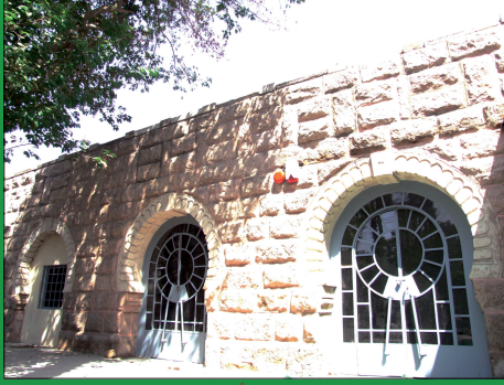
متحف الصيد بقصر الأمير محمد علي بالمنيل