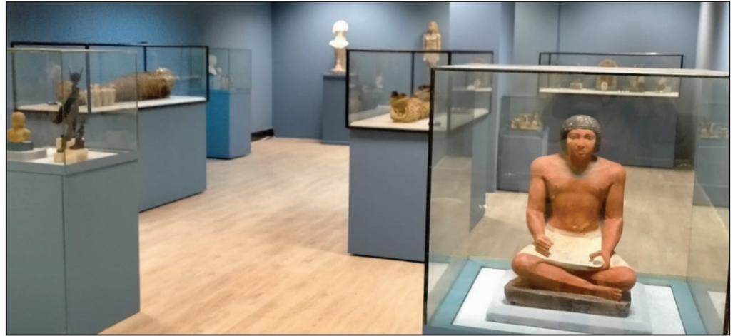
قاعة العرض بالمتحف

تقوم الوزارة بالتجهيزات النهائية لكافة الأعمال بالقاعة المخصصة لمتحف المطار بصالة عرض بمبنى ركاب ٣، حيث تم وضع القطع الأثرية وتوزيعها داخل فئتين العرض، وجاري الآن الانتهاء من أعمال الإضاءة والبطاقات التعريفية للقطع. المتحف يضم حوالي ٧٠ قطعة أثرية تم اختيارها بعناية من قبل اللجنة العليا لسيناريو العرض المتحفي، من مخازن عدد من المتاحف منها مخازن المتحف المصري بالتحريم ومتحف السويس والمتحف اليوناني الروماني، وذلك لتعكس الأوجه المختلفة للحضارة المصرية العريقة منذ العصور المصرية القديمة والقبطية والإسلامية.