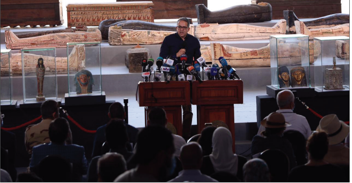
جانب من المؤتمر الصحفي