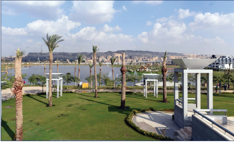
حديقة المتحف بجوار بحيرة عين الصيرة

في إطار التعاون بين الهيئة الهندسية للقوات المسلحة والوزارة، قام الوزير ورئيس الهيئة، يوم ٢٦ نوفمبر، بجولة تفقدية للمتحف القومي للحضارة المصرية بالفسطاط، والمتحف المصري الكبير، ومشروع ترميم قصر محمد علي بشبرا، وذلك للوقوف على آخر مستجدات الأعمال بهم. بدأت الجولة بزيارة المتحف القومي للحضارة المصرية، حيث تم تفقد أعمال تطوير بحيرة عين الصيرة والمنطقة الموجودة أمام المتحف، وقاعة العرض الرئيسية وقاعة المومياءات اللاتي سيتم افتتاحهما قريبا. ثم انتقلت الجولة إلى المتحف المصري الكبير بميدان الرماية حيث تم تفقد الواجهة والبهو والدرج العظيم وقاعتي العرض الخاصة بكنوز الملك توت عنخ آمون. وانتهت الجولة بقصر محمد علي بشبرا، حيث تم زيارة كشك الجبلية والتي انتهت من ترميمه بالكامل الهيئة الهندسية للقوات المسلحة، وسرايا الفسقية والتي تم الانتهاء من ٧٦٪ من أعمال ترميمها. رافق الوفد الأمين العام للمجلس الأعلى للآثار، ومساعد الوزير للشئون الهندسية، وعدد من قيادات الوزارة والهيئة الهندسية.