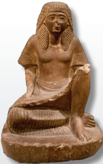
زهثال جالس للمشرف على معبد الكرنك - خبيءة الكرنك - الأسرة التاسعة عشر - دولة حديثة