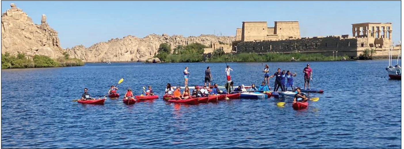
جانب من السباق

استضافت مدينة أسوان، خلال الفترة من ٢١ وحتى ٢٣ نوفمبر، فعاليات البطولة الدولية لرياضة التجديف "الكاياك" والتي تم تنظيمها تحت رعاية الوزارة ممثلة في الهيئة المصرية العامة للتنشيط السياحي وبالتعاون مع وزارة الشباب والرياضة والاتحاد المصري للكانوي والكاياك ومحافظة أسوان. وقد انطلقت فعاليات هذا السباق من المنطقة المحيطة بجزيرة معبد فيلة بأسوان، وقد جاء اختيار مصر وخاصة مدينة أسوان لإقامة هذا السباق للطقس الدافئ الذي تتميز به مقارنة بأوروبا في هذا التوقيت.