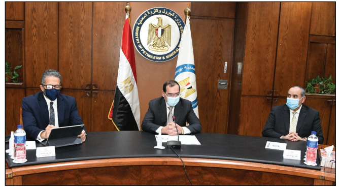
جانب من الاجتماع

اجتمع الوزير، يوم ٢٤ نوفمبر، مع وزيري البترول والثروة المعدنية، والطيران المدني لمناقشة عدد من الموضوعات الهامة التي تدعم القطاع السياحي وتخفف نشاط الطيران، وذلك في ضوء حرص الدولة على تقديم الدعم المستمر لقطاع السياحة وسعيًا للحفاظ على مكانة مصر على خريطة السياحة العالمية. وتم خلال الاجتماع استعراض عدد من المقترحات والمبادرات الجديدة التي سيتم دراستها وبحث آليات تنفيذها خلال الفترة القادمة لدعم برنامج تخفيف الطيران للمقاصد السياحية المصرية.