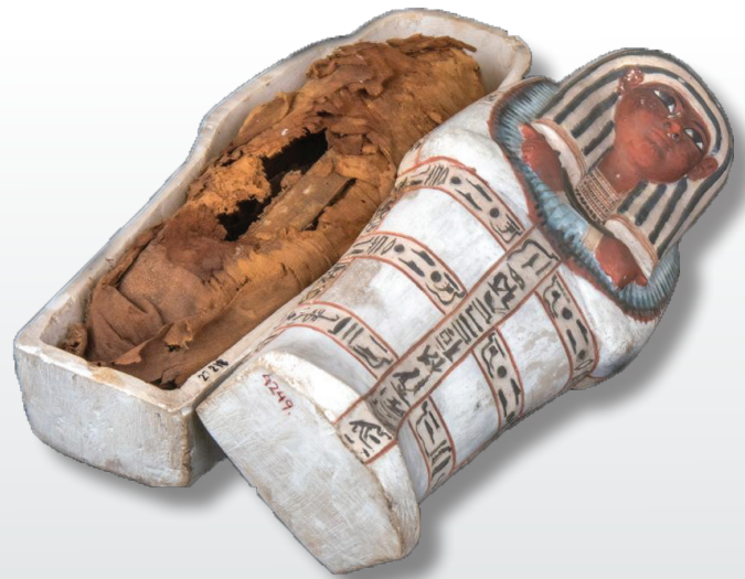
اناء كانوبس على شكل نموذج تابوت - مقبرة سنجم بدير المدينة - الأسرة التاسعة عشر - دولة حديثة