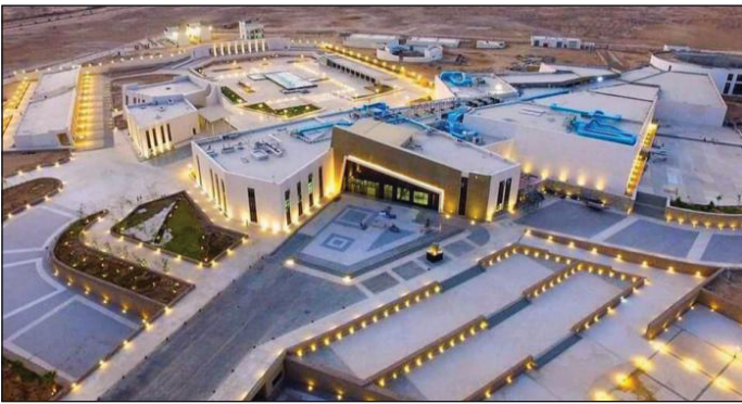
متحف شرم الشيخ

نظم متحف شرم الشيخ بمحافظة جنوب سيناء، خلال شهر نوفمبر، محاضرة وجولة إرشادية لمجموعة من المرشدين السياحيين لتعريفهم بالمتحف والقطع الأثرية المعروضة به وما يساهم في تمكينهم من شرح مقتنياته وسيناريو العرض الخاص به للسائحين بطريقة سهلة ومشوقة، حيث تم تسليط الضوء على فلسفة العرض المتحفي للقاعات والقطع الأثرية التي تعبر عن تنوع وثراء الحضارة المصرية العريقة عبر العصور التاريخية المختلفة، بالإضافة إلى الهدف والرسالة التي يجب أن يقدمها المتحف للزائرين.