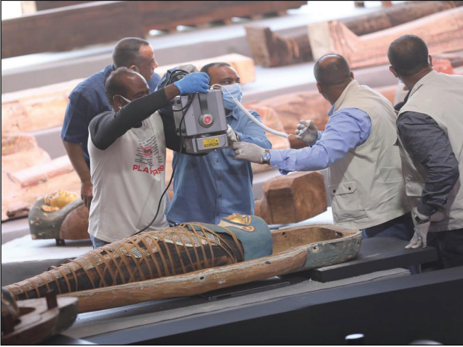
أثناء عمل X-Ray للمومياء

وسط تغطية إعلامية عالمية ومحلية واسعة، وبحضور ما يقرب من ٣٦ سفيراً أجنبياً وعربياً وإفريقياً في القاهرة وعدد من الشخصيات العامة والفنانين المصريين، أعلنت وزارة السياحة والآثار، يوم ١٤ نوفمبر، عن كشف أثري جديد بمنطقة آثار سقارة، حيث عثرت البعثة الأثرية المصرية العاملة بالمنطقة على أكثر من ١٠٠ تابوت خشبي مغلق بحالتهم الأولى من العصر المتأخر والبطلمي داخل ثلاثة آبار للدفن، يتراوح عمقها ما بين ١٠ إلى ١٢ متر تحت سطح الأرض، بالإضافة إلى ٤٠ تمثالاً للإله جبانة سقارة "بتاح سوكر" منها تماثيل بأجزاء مذهبة و٢٠ صندوقاً خشبياً للإله حورس، وتماثيل لشخص يدعى "بنومس" مصنوعين من خشب السنط "أكاسيا"، وعدد من تماثيل الأوشابتي والتائم، و٤ أقنعة من الكارتوناغ المذهب. وخلال الإعلان عن الكشف، تم فتح أحد التوابيت وعمل X-Ray للمومياء التي وجدت بداخله. ومن المقرر أن يتم تقسيم التوابيت التي تم الكشف عنها لنقلها إلى المتحف المصري الكبير، والمتحف القومي للحضارة المصرية، والمتحف المصري بالتحرير، ومتحف العاصمة الإدارية الجديدة.