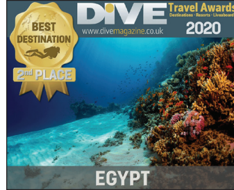
مصر تفوز بالمركز الثاني كأفضل وجهة للغوص في العالم ٤ ص