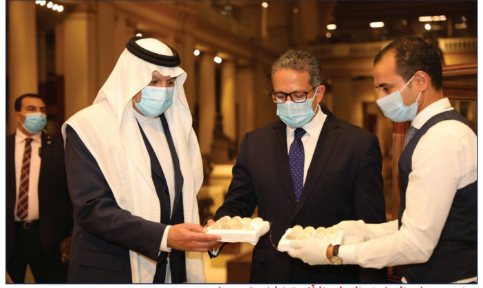
مراسم تسلم السفراء القطع الأثرية الخاصة بدولهم

احتفلت الوزارة، يوم ١٧ نوفمبر، بمرور ١١٨ عاماً على تأسيس المتحف المصري بالتحرير والذي يضم أكبر مجموعة من آثار مصر القديمة في العالم، ويُعد قبلة الزائرين والدارسين من جميع أنحاء العالم. ضمت الاحتفالية افتتاح معرضين للآثار؛ الأول معرضاً دائماً بعنوان "الخبيئات: الكنوز الخفية" يعرض فيه ٥٠ تابوتا ملونا منهم اثنين من الكشف الأثري الذي تم بمنطقة سقارة، و٤٨ تابوتا من مخازن المتحف المصري بالتحرير من بينهم ١٥ تابوتا يتم عرضهم لأول مرة، والمعرض الثاني مؤقتاً وخاص بالمضبوطات الأثرية. حضر الاحتفالية سفراء كل من دول الولايات المتحدة الأمريكية والمملكة العربية السعودية وجمهورية الصين وممثل سفارة الهند. وخلال الاحتفالية تم تسليم المملكة العربية السعودية والصين والهند لعملات أثرية تخص بلادهم تم ضبطها عن طريق المنافذ المصرية، تشمل ١٠٠ عملة تم تسليمها باسم الحكومة المصرية لحكومات الدول الثلاث.