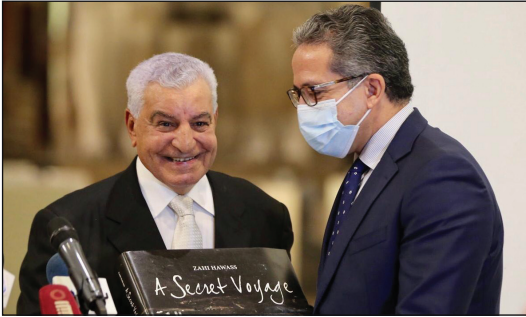
جانب من الافتتاح

في إطار احتفال الوزارة بمرور ٢٣ عاماً على افتتاح متحف النوبة، استقبل المتحف، يوم ٢٣ نوفمبر، زائريه مجاناً. ويعد متحف النوبة تحفة معمارية فريدة ويحتوي على أكثر من ٥٠٠٠ قطعة أثرية تمثل مراحل تطور الحضارة والتراث النوبي.