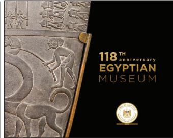
الاحتفال بمرور ١١٨ عاماً على تأسيس المتحف المصري بالتحرير ٦ ص