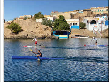
أسوان تستضيف البطولة الدولية لـ "الكايك" ٣ ص