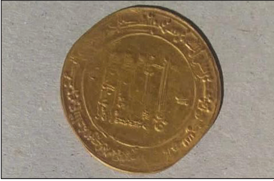
أحد العملات المكتشفة