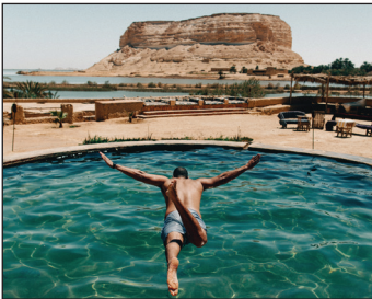
سيوة واحة السحر والجمال ٨ ص

وسط تغطية إعلامية عالمية ومحلية واسعة، وبحضور ما يقرب من ٣٦ سفيراً أجنبياً وعربياً وإفريقياً في القاهرة وعدد من الشخصيات العامة والفنانين المصريين، أعلنت وزارة السياحة والآثار، يوم ١٤ نوفمبر، عن كشف أثري جديد بمنطقة آثار سقارة، حيث عثرت البعثة الأثرية المصرية العاملة بالمنطقة على أكثر من ١٠٠ تابوت خشبي مغلق بحالتهم الأولى من العصر المتأخر والبطلمي داخل ثلاثة آبار للدفن، يتراوح عمقها ما بين ١٠ إلى ١٢ متر تحت سطح الأرض، بالإضافة إلى ٤٠ تمثالاً للإله جبانة سقارة "بتاح سوكر" منها تماثيل بأجزاء مذهبة و٢٠ صندوقاً خشبياً للإله حورس، وتماثيل لشخص يدعى "بنومس" مصنوعين من خشب السنط "أكاسيا"، وعدد من تماثيل الأوشابتي والتائم، و٤ أقنعة من الكارتوناغ المذهب. وخلال الإعلان عن الكشف، تم فتح أحد التوابيت وعمل X-Ray للمومياء التي وجدت بداخله. ومن المقرر أن يتم تقسيم التوابيت التي تم الكشف عنها لنقلها إلى المتحف المصري الكبير، والمتحف القومي للحضارة المصرية، والمتحف المصري بالتحرير، ومتحف العاصمة الإدارية الجديدة.