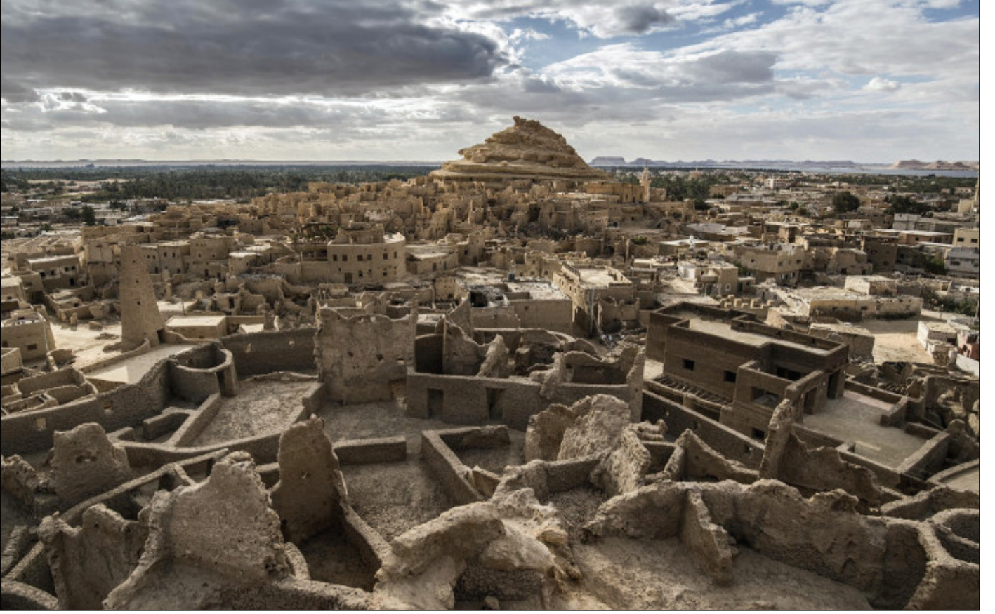
مدينة شالي الأثرية

شارك الوزير، يوم ٦ نوفمبر في افتتاح قلعة شالي وجامع اغورمي بواحة سيوة بمحافظة مطروح بعد الانتهاء من أعمال ترميمهم، وذلك في إطار مشروع إحياء قرية شالي الأثرية، حيث يتيح هذا المشروع فرصة للزائرين والسائحين بالتجول في شالي وأروقها المختلفة والتنقل ما بين البيوت والجوامع لمشاهدة العمارة المميزة للمدينة والتي تعود لأكثر من ٨٠٠ سنة. حضر الافتتاح وزيرة البيئة، ووزيرة التعاون الدولي، ومحافظ مطروح، ورئيس قطاع الآثار الإسلامية والقبطية واليهودية بالوزارة، ورئيس مجلس إدارة شركة نوعية البيئة الدولية لتنمية المشروعات الصغيرة والمتوسطة، بالإضافة إلى ممثل عن الاتحاد الأوروبي، و٢٠ سفيراً من سفراء دول العالم بالقاهرة. جدير بالذكر أن مشروع إحياء قرية شالي ممول من الاتحاد الأوروبي بنسبة ٩٠٪ بتكلفة تصل إلى ٦٠٠ ألف يورو، وشركة نوعية البيئة الدولية لتنمية المشروعات الصغيرة والمتوسطة تساهم بنسبة ١٠٪ من قيمة المشروع. وتشجيعاً للحرف التقليدية والتراثية التي يقوم بها أهالي سيوة، تم إعفاء مستأجري المحلات التي تباع المنتجات التراثية في قلعة شالي من دفع القيمة الإيجارية لآخر العام، وذلك ضمن جهود وزارة السياحة والآثار لتخفيف الآثار الاقتصادية الناتجة عن أزمة فيروس كورونا المستجد.