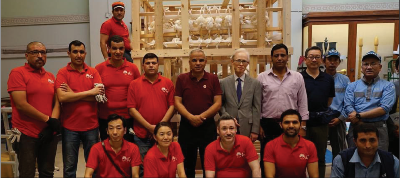
صورة جماعية لفريق المشروع

فاز فريق هيئة التعاون الدولي اليابانية "المشروع المصري الياباني المشترك لحفظ وترميم الآثار بالمتحف المصري الكبير" بجائزة يوم ميوري للتعاون الدولي، في نسختها السابعة والعشرون، وذلك نظرًا للجهد المبذول من فريق العمل المصري الياباني في أعمال ترميم وحفظ القطع الأثرية بالمتحف. وتُمنح هذه الجائزة برعاية جريدة يوم ميوري وهي إحدى الجرائد اليابانية الرائدة والتي تم الاعتراف بها من قبل موسوعة جينيس كأكبر توزيع في العالم حوالي ٨ ملايين نسخة في اليوم، وهي جائزة ذات شهرة واسعة في اليابان، وتُمنح للأفراد والجماعات اليابانية ممن يحققون إنجازات بارزة في مجال التعاون الدولي.