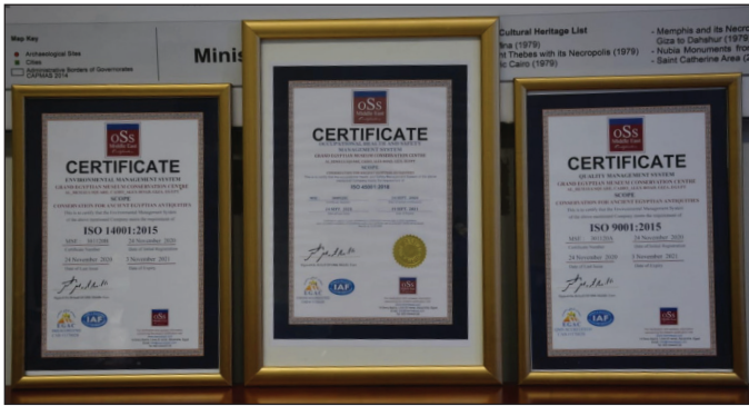
شهادات الأيزو الثلاث

حصل المتحف متمثلاً في مركز ترميم الآثار يوم ٢٩ نوفمبر ٢٠٢٠ على شهادتي اعتماد المواصفات القياسية الدولية الأيزو ISO: الأولى خاصة بنظام إدارة البيئة، والثانية خاصة بنظام إدارة الجودة، بالإضافة إلى شهادة الأيزو الخاصة بالسلامة والصحة المهنية، والتي كان المتحف قد حصل عليها في سبتمبر الماضي. وبهذا يكون المتحف المصري الكبير قد حصد ثلاث شهادات أيزو خلال أقل من ٦٠ يوماً، في كل من البيئة والجودة والسلامة والصحة المهنية، ليكون ذلك هو المرة الأولى من نوعها على المستوى الدولي والإقليمي، والتي يحصد فيها متحف علي هذه الشهادات الثلاث.