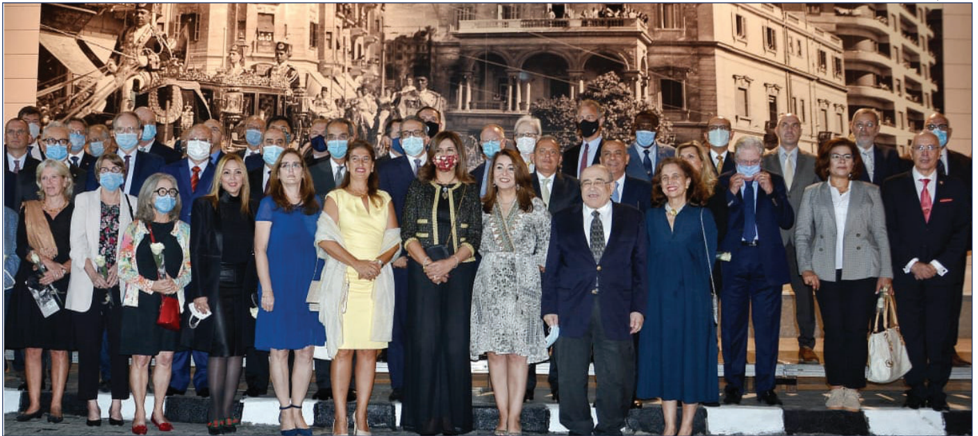
صورة جماعية بمناسبة الافتتاح

نظمت الوزارة، يوم 1 نوفمبر، احتفالية بمتحف المركبات الملكية ببولاق وذلك بمناسبة افتتاحه ضمن الثلاث متاحف التي قام فخامة رئيس الجمهورية بافتتاحها يوم ٣١ أكتوبر والتي شملت أيضًا متحف شرم الشيخ وكفر الشيخ. حضر الاحتفالية عددا من الوزراء والمسؤولين، وبعض الفنانين المصريين وحوالي 50 سفيراً من سفراء الدول الأجنبية والعربية والأفريقية المختلفة في القاهرة وعائلاتهم. وتم خلال الاحتفالية عرض عدد من الأفلام الترويجية منها فيلم قصير عن متحف المركبات الملكية، وفيلم آخر عن متاحف المركبات الملكية ببولاق وشرم الشيخ وكفر الشيخ، بالإضافة إلى عرض فيلم "سائح في مصر" الذي أطلقته الوزارة في إطار حملتها الترويجية Same Great Feelings، وأقيم على هامش هذه الاحتفالية معرض "تراث مصر" للحرف التراثية والمنتجات اليدوية، وبعض الورش الفنية.