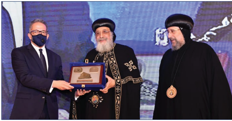
جانب من الإحتفالية

في احتفالية عرض الفيلم الوثائقي "مسار العائلة المقدسة" الذي أعدته راهبات دير الشهيد العظيم مار جرجس بمصر القديمة ألقى الوزير، يوم ٧ نوفمبر، كلمة نيابة عن رئيس مجلس الوزراء، بمسرح الأنبا رويس بالكاتدرائية المرقسية بالعباسية، حيث حضر الاحتفالية قداسة بابا الإسكندرية وبطريك الكرازة المرقسية، ووزيرة الهجرة وشئون المصريين بالخارج، في الاحتفالية التي شهدتها قداسة البابا، للعرض الخاص للفيلم التسجيلي "المكتبة البابوية المركزية"، بالمركز الثقافي القبطي بالكاتدرائية.