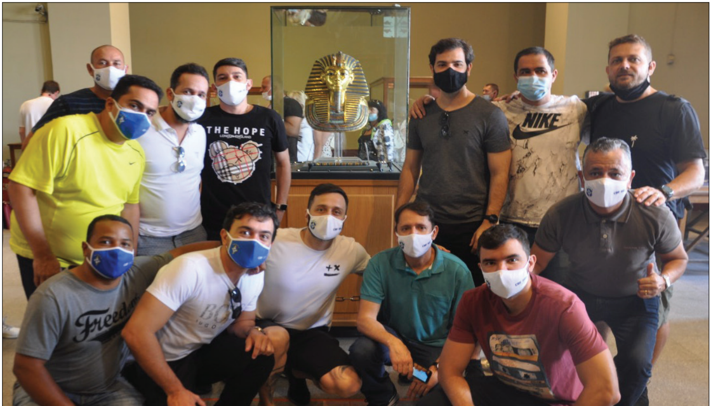
المنتخب داخل المتحف المصري بالتحرير

قامت بعثة المنتخب الأولمبي البرازيلي لكرة القدم تحت ٢٣ سنة، يوم ١٨ نوفمبر، بجولة بأهرامات الجيزة حيث زاروا الهرم الأكبر وتمثال أبو الهول ومنطقة البانوراما، كما زار أعضاء بعثة المنتخب البرازيلي المتحف المصري بالتحرير، حيث قاموا بجولة داخل قاعات المتحف المختلفة بدأت بزيارة آثار الدولة القديمة ومشاهدة مجموعة الملك توت عنخ آمون.