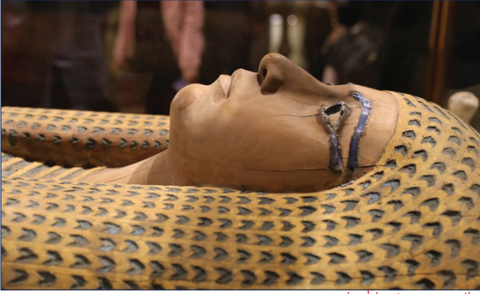
جانب من معرض الخبيئات