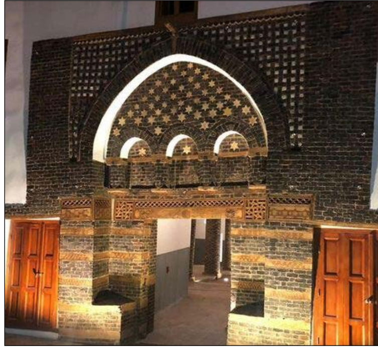
وكالة الجداوي الأثرية

افتتح الوزير، في ٢٩ أغسطس، وكالة الجداوي الأثرية بمدينة إسنا، وذلك بعد الانتهاء من مشروع ترميمها وتطويرها والذي استغرق ما يقرب من عامين من العمل الجاد والشاق وتمويل من الوكالة الأمريكية للتنمية الدولية USAID، برفقة محافظ الأقصر، والسفير الأمريكي بالقاهرة، والأمين العام للمجلس الأعلى للآثار، ومساعد الوزير للمشروعات والمشرق العام على القاهرة التاريخية، ورئيس قطاع الآثار الإسلامية والقبطية واليهودية بالمجلس الأعلى للآثار. وخلال زيارته للأقصر، توجه الوزير لمعبد إسنا، حيث تفقد آخر مستجدات الأعمال والموقف التنفيذي بمشروع تنظيف وإعادة ألوانه الى سابق عهدها، ومتابعة التجهيزات اللازمة لأعمال تطوير المنطقة الأثرية بأكملها. كما زار معبد الطود، للوقوف على حالة المعبد تمهيداً للبدء في أعمال ترميمه وتطوير خدمات الزائرين به.