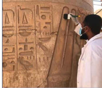
رئيس الوزراء ينقل لشباب الهرميين بمعبد الكرنك زخايات فخامة الرئيس ص ٣