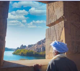
يوم وفاء النيل ص ١٨

كما تم استئناف الحركة الجوية الروسية إلى المنتجعات السياحية المصرية، حيث استقبلت مدينتي الغردقة وشرم الشيخ أولى الرحلات الروسية القادمة من موسكو في ٩ أغسطس. (التفاصيل ص ١٦-١٧).