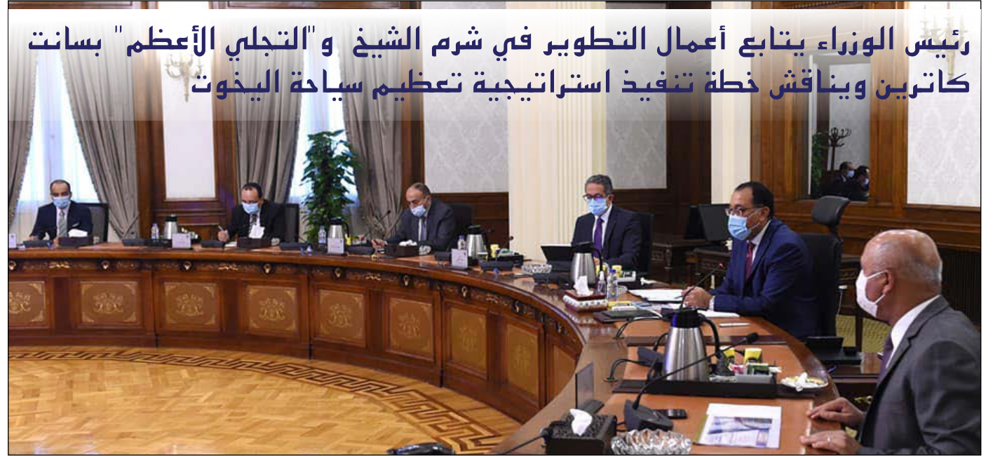
جانب من أحد الاجتماعات

عقد رئيس مجلس الوزراء، خلال شهر أغسطس، عدة اجتماعات حضرها الوزير وعدد من الوزراء والجهات المعنية لمتابعة مشروعات التطوير التي تتم في المقاصد السياحية المختلفة، ومنها أعمال التطوير التي تتم في مدينة شرم الشيخ، حيث أكد رئيس الوزراء أن هناك توجيهاً من فخامة الرئيس بالاهتمام الكامل بأعمال تعقيم كافة المنشآت السياحية في شرم الشيخ، وتطبيق الإجراءات الاحترازية وتوفير كل الخدمات للحفاظ على نشاط هذا القطاع.