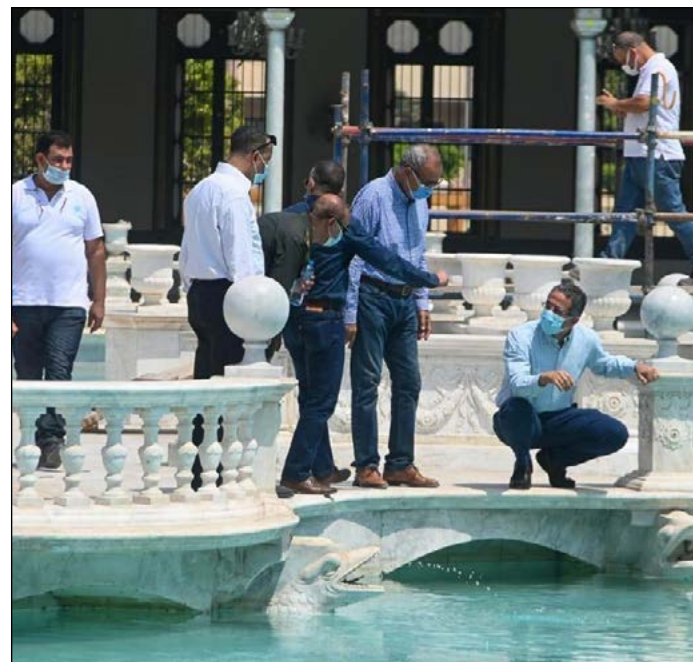
جانب من جولة الوزير بالقصر

تجري الاستعدادات على قدم وساق في مشروع ترميم وإعادة تأهيل قصر محمد علي بشبرا الخيمة، وقد قام الوزير بزيارة القصر يوم ٤ أغسطس، لمتابعة سير الأعمال وآخر مستجدات الموقف التنفيذي للمشروع، الذي تنفذه الوزارة بالتعاون مع الهيئة الهندسية للقوات المسلحة، طبقاً للبروتوكول الموقع عام ٢٠١٧، شملت الجولة تفقد مبنى قصر الفسقية والغرف التي يتكون منها القصر ومسار الزيارة، ووجه الوزير بإجراء التعديلات لرفع كفاءة الخدمات المقدمة للزائرين لتحسين تجربتهم أثناء الزيارة، وتأهيل مسارات الزيارة وإتاحتها لذوي الاحتياجات الخاصة.