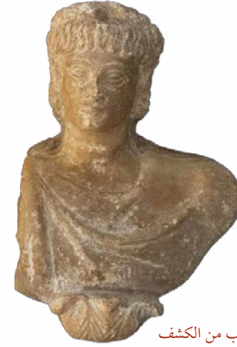
جانب من الكشف

نجحت البعثة الأثرية المصرية من منطقة آثار إسكندرية في الكشف عن بقايا ضاحية سكنية ونجارية من العصرين اليوناني والروماني، وذلك أثناء أعمال الحفائر بمنطقة الشاطبي، وترجع أهمية هذا الكشف إلى أنه يلقي الضوء على الأنشطة المختلفة التي كانت تتم عند الأسوار الخارجية للعاصمة المصرية في العصرين اليوناني والروماني، وجاري حالياً الأعمال النهائية لتوثيق الموقع باستخدام التصوير ثلاثي الأبعاد وتقنيات الرفع الطبوغرافي الحديثة، ومن المقرر نقل اللقى الأثرية إلى معامل الترميم التابعة للوزارة لإجراء أعمال الترميم اللازمة لها ومحاولة إعادة تجميع بقايا التماثيل المكتشفة.