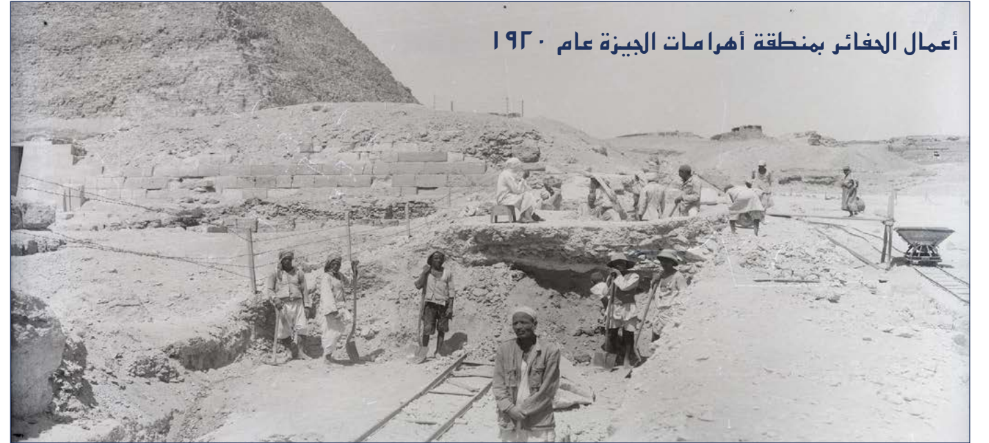
أعمال الحفائر بمنطقة أهرامات الجيزة عام ١٩٢٠