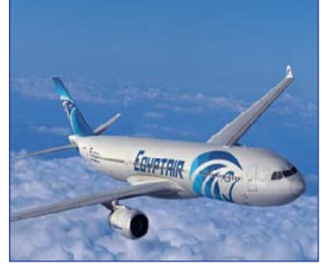
استحداث برنامج لتحفيز الطيران الداخلي لربط المدن الساحلية بمحافظات الصعيد ص ٢