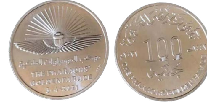
صورة العملة التذكارية

تخليداً لحدث موكب نقل المومياوات الملكية من المتحف المصري بالتحرير الى المتحف القومي للحضارة المصرية بالفسطاط يوم ٣ ابريل ٢٠٢١، أصدرت وزارة المالية عملة تذكارية من الفضة فئة ١٠٠ جنيه تحمل شعار الاحتفالية باللغتين العربية والإنجليزية لتوثيق هذا الحدث الاستثنائي، بالإضافة إلى إصدار عملات معدنية قابلة للتداول من فئة الجنيه والخمسون قرشاً، تحمل نفس تصميم العملات الفضية، وذلك وفقاً لقرار رئيس مجلس الوزراء.