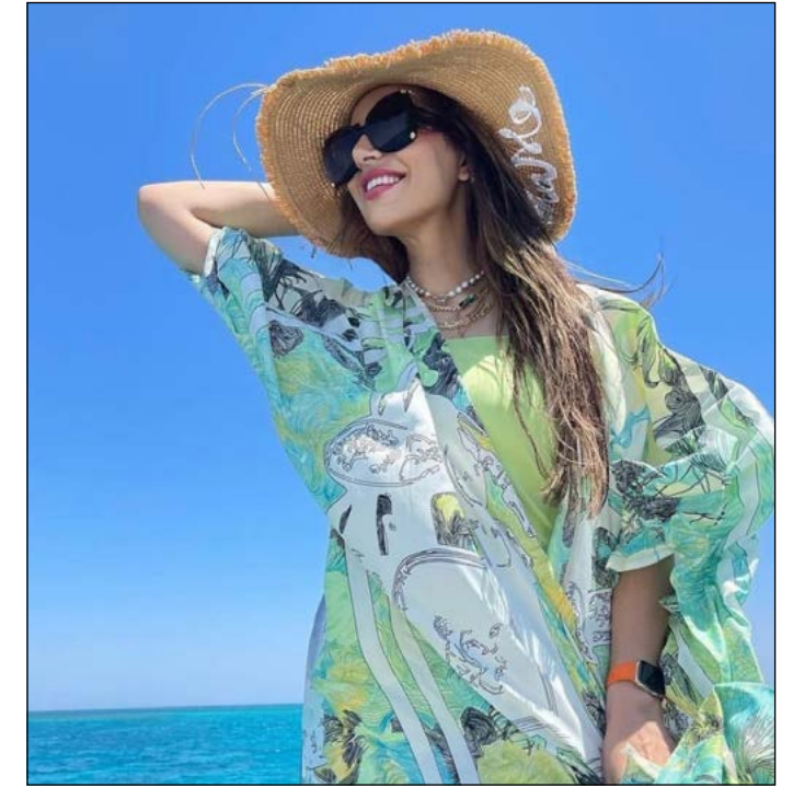
جانب من زيارة المؤثرين لمصر

نظمت الوزارة، خلال الشهر، زيارة تعريفية إلى مصر لمجموعة من المؤثرين العرب الذين يتمتعون بعدد كبير من المتابعين على منصات التواصل الاجتماعي المختلفة حيث تتراوح أعدادهم ما بين ٥٠٠ ألف ومليون ونصف متابع، تضمنت الزيارة محافظات كل من القاهرة والاسكندرية والبحر الأحمر، حيث زاروا في القاهرة كل من منطقة أهرامات الجيزة وقلعة صلاح الدين الأيوبي والمتحف القومي للحضارة المصرية بالفسطاط وحديقة الأزهر ومنطقة خان الخليلي، كما قاموا برحلة نيلية للاستمتاع بالليل في القاهرة الساحرة، وزاروا في الإسكندرية عدة معالم سياحية منها قلعة قايتاي.