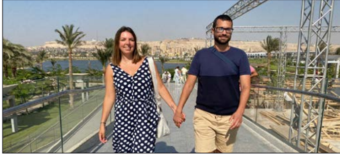
جانب من زيارة العروسين للمتحف

عرض المتحف خلال شهر أغسطس، أربعة قطع من الأزياء والاكسسوارات التي تم استخدامها في موكب المومياوات الملكية الذي تابعه العالم يوم ٣ أبريل الماضي، كما عرض النوتة الموسيقية والعصا الخاصة بقائد الأوركسترا، تأتي فكرة عرض هذه القطع لإثراء وتطوير العرض المتحفي به وجذب المزيد من الزوار خاصة الذين تابعوا هذا الحدث الاستثنائي. وقد واصل المتحف استقبال ضيوفه، حيث زار المتحف وزير خارجية جمهورية صربيا، ومدير ادارة الشرق الأوسط بالخارجية الصربية، والسفيرة الصربية بالقاهرة، كما استقبل المتحف الفوج السياحي الإسباني الذي وصل على متن أولى رحلات الطيران العارض القادمة من إسبانيا إلى الأقصر منذ استئناف حركة السياحة الوافدة في يوليو ٢٠٢٠، وذلك بعد انتهاء برنامج رحلتهم السياحية في مدينتي الأقصر وأسوان، كما استقبل شباب ملتقي "الوجوس للشباب ٢٠٢١".