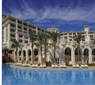
تكثيف لجان التفتيش وإعادة تقييم الفنادق وفقا لمعايير التصنيف الجديدة ص ٣