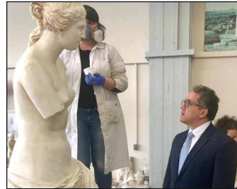
وزير السياحة والآثار يزور اليونان في أولى جولاته الخارجية ص ٣