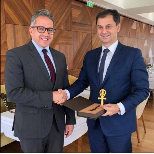
وزير السياحة والآثار المصري مع وزير السياحة اليوناني

في أولى جولاته الخارجية بعد دمج وزارتي السياحة والآثار، قام وزير السياحة والآثار بناء على الدعوة الموجه إليه من الجانب اليوناني بزيارة العاصمة اليونانية أثينا، وخلال الزيارة التقى مع وزير السياحة والثقافة والرياضة اليونانيين. وعقد سيادته مع وزيرة الثقافة والرياضة اليونانية، مؤتمراً صحفياً، حضره العديد من ممثلي وسائل الإعلام اليونانية والعالمية، حيث تم استعراض ما توصلت إليه المباحثات الثنائية ومناقشة تعزيز سبل التعاون لمحاربة الإتجار الغير مشروع في الآثار. وعقد الوزير خلال زيارته، عددا من اللقاءات الصحفية والتلفزيونية مع العديد من القنوات التلفزيونية اليونانية ووكالات الأنباء العالمية منها أسوشيتد برس ورويترز والوكالة الفرنسية وغيرها. كما قام الوزير بعدة زيارات منها: عدد من المتاحف اليونانية الكبرى، ومنطقة الاكروبول الأثرية والمسجلة على قائمة التراث العالمي اليونسكو، وورشنة لانتاج المستنسخات الأثرية للاستفادة من التقنيات الموجودة بها.