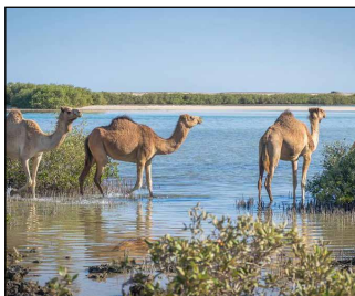
محمية وادي الجمال ص ٨

افتتح رئيس مجلس الوزراء «متحف آثار الغردقة» وهو أول متحف للآثار في محافظة البحر الأحمر، بحضور وزير السياحة والآثار ووزير قطاع الأعمال العام والطيران المدني ومحافظ البحر الأحمر، وعدد من السفراء، وسط تغطية إعلامية محلية ودولية واسعة. يأتي ذلك في إطار اتجاه وزارة السياحة والآثار لربط السياحة الثقافية بالسياحة الترفيهية والشاطئية، وإبراز الإمكانيات الهائلة لمصر وما تتمتع به من تنوع وغنى في منتجاتها السياحية التي تجذب جميع الشرائح وترضى كافة الأذواق من السائحين. يضم متحف الغردقة ١٧٩١ قطعة أثرية تروى تاريخ الحضارة المصرية بدءاً من العصور المصرية القديمة، واليونانية والرومانية، مروراً بالعصور المسيحية والإسلامية وصولاً للعصر الحديث، ويعد التمثال الفريد لمريت آمون ابنة الملك رمسيس الثاني والملكة نفرتاري هو القطعة المحورية بالمتحف. ويعد متحف الغردقة هو أول متحف يتم بناؤه بالشراكة مع القطاع الخاص، وتكون إدارته بالكامل مسؤولية وزارة السياحة والآثار.