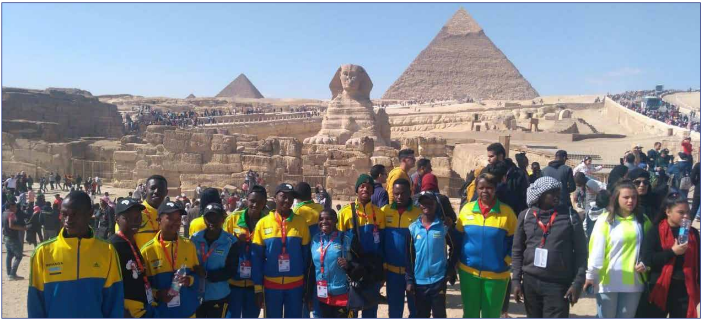
وفد دورة الألعاب الإقليمية الأفريقية في منطقة الأهرامات

استقبلت منطقة الأهرامات الأثرية وفد دورة الألعاب الإقليمية الأفريقية للاولمبياد، واستضافت وزارة السياحة والآثار وفد صحفي بريطاني في زيارة لأهم المناطق الأثرية بمدينتي القاهرة والأقصر، وزارت الممثلة الإسبانية الشهيرة فكتوريا أبريل معبد فيلة ومعبد أبو سمبل، وذلك في إطار الترويج لمصر ودفع مزيد من الحركة السياحية إليها.