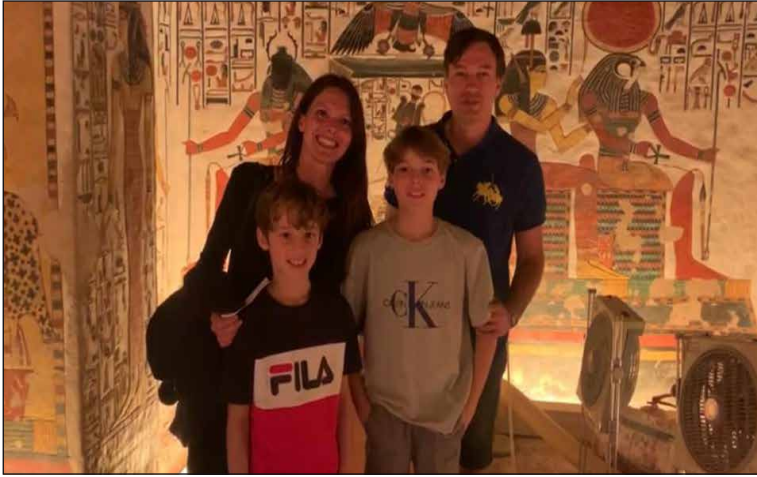
أول فوج سياحي لرحلة طيران شرم - الأقصر يزور مقبرة نفرتاري

في إطار سياسة ربط البحر الأحمر بآثار وادي النيل في صعيد مصر وفي إطار التنسيق الدائم بين وزارتي السياحة والآثار والطيران المدني، بدأت شركة مصر للطيران بتشغيل أولى رحلاتها بين مدينة شرم الشيخ والأقصر في ٢٠ فبراير ٢٠٢٠ بواقع رحلة أسبوعية، وذلك لأول مرة بعد توقف دام عدة سنوات.