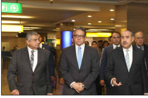
جولة وزير السياحة والآثار، والطيران المدني داخل مطار القاهرة الدولي

في إطار التنسيق والتعاون الدائم و المثمر بين وزارتي السياحة والآثار و الطيران المدني من أجل تشييط الحركة السياحية و الجوية الوافدة الى جمهورية مصر العربية ، قام وزير السياحة و الآثار ووزير الطيران المدني بجولة ميدانية داخل مطار القاهرة الدولي لتفقد المكاتب السياحية التابعة لوزارة السياحة والآثار و ذلك للوقوف على حالتها الراهنة ومدى كفاءتها لخدمة السائحين، كما تفقدا القاعات الجديدة التي تم تخصيصها لإقامة متحفين للآثار داخل المطار، وقد أوصى وزير السياحة والآثار برفع كفاءة المكاتب الخاصة بوزارة السياحة والآثار عن طريق توفير عدد أكبر من النشرات السياحية والأثرية وشاشات عرض الأفلام الوثائقية لأهم المناطق السياحية بمصر.، وأعقب هذه الجولة اجتماع تنسيقي بين الوزيرين لمناقشة كافة سبل التعاون.