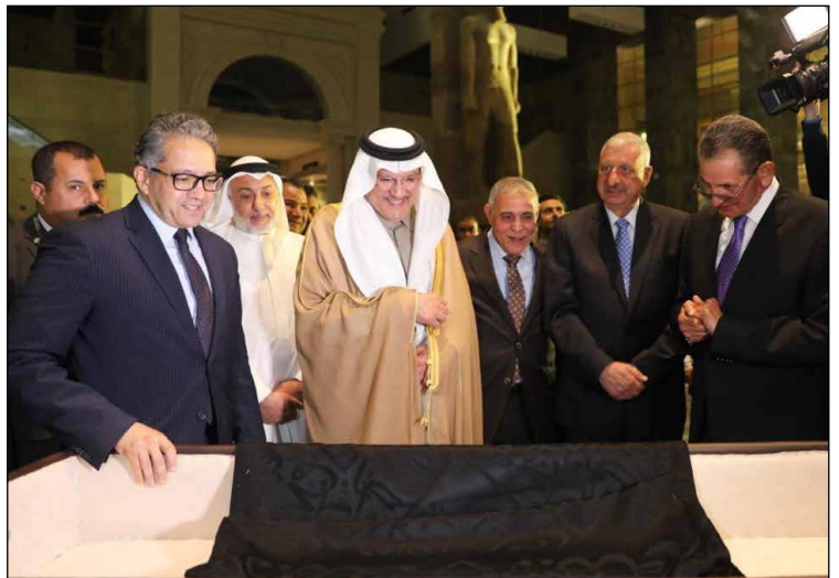
جانب من مراسم استلام جزء من كسوة الكعبة

في إطار التعاون الثقافي بين مصر والسعودية، تسلم وزير السياحة والآثار من سفير دولة السعودية بالقاهرة جزء من كسوة الكعبة كهديّة من المملكة لمتحف الآثار بالعاصمة الإدارية الجديدة. حضر مراسم التسليم مستشار السيد رئيس الجمهورية للشئون المالية ونائب الوزير للشئون السياحية، وقبل مراسم التسليم قام الحضور بجولة تفقدية بالمتحف الذي يروي تاريخ العواصم المصرية المختلفة.