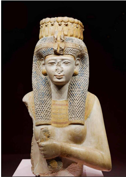
تمثال مريت آمون

افتتح رئيس مجلس الوزراء «متحف آثار الغردقة» وهو أول متحف للآثار في محافظة البحر الأحمر، بحضور وزير السياحة والآثار ووزير قطاع الأعمال العام والطيران المدني ومحافظ البحر الأحمر، وعدد من السفراء، وسط تغطية إعلامية محلية ودولية واسعة. يأتي ذلك في إطار اتجاه وزارة السياحة والآثار لربط السياحة الثقافية بالسياحة الترفيهية والشاطئية، وإبراز الإمكانيات الهائلة لمصر وما تتمتع به من تنوع وغنى في منتجاتها السياحية التي تجذب جميع الشرائح وترضى كافة الأذواق من السائحين. يضم متحف الغردقة ١٧٩١ قطعة أثرية تروى تاريخ الحضارة المصرية بدءاً من العصور المصرية القديمة، واليونانية والرومانية، مروراً بالعصور المسيحية والإسلامية وصولاً للعصر الحديث، ويعد التمثال الفريد لمريت آمون ابنة الملك رمسيس الثاني والملكة نفرتاري هو القطعة المحورية بالمتحف. ويعد متحف الغردقة هو أول متحف يتم بناؤه بالشراكة مع القطاع الخاص، وتكون إدارته بالكامل مسؤولية وزارة السياحة والآثار.