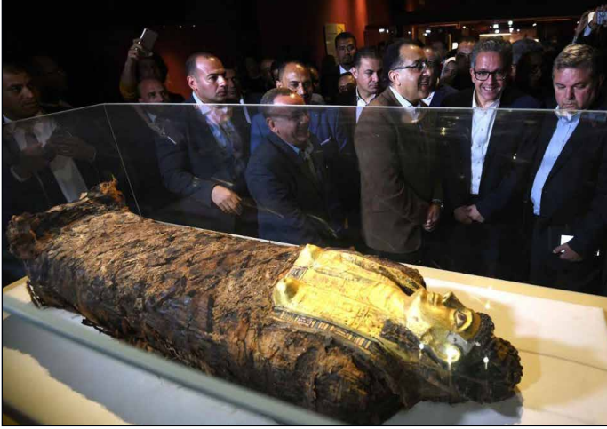
..ويتفقد إحدى قاعات العرض بالمتحف