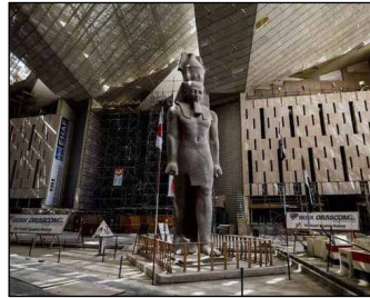
صدور قانوني المتحف المصري الكبير و متحف الحضارة ص ٤