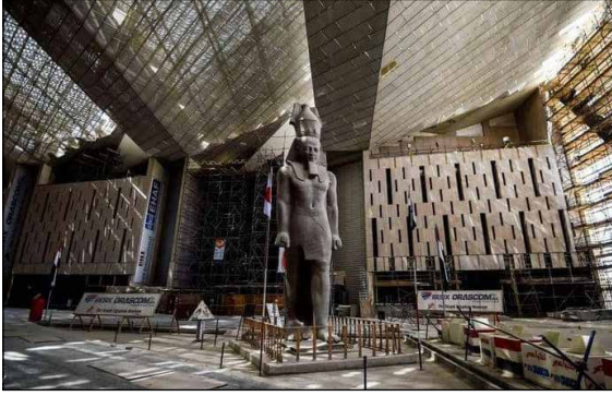
تمثال رمسيس الثاني في بهو المتحف المصري الكبير

أصدر فخامة رئيس الجمهورية القانون رقم ٩ لسنة ٢٠٢٠ والخاص بهيئة المتحف المصري الكبير، والذي ينص على اعتبار المتحف المصري الكبير هيئة عامة اقتصادية تتبع الوزير المختص بشئون الآثار، وأنها مجمع حضاري عالمي متكامل، تهدف إلى التعرف على الحضارة المصرية، وتوفير الخدمات والأنشطة الثقافية اللازمة للزائرين. كما أصدر الرئيس عبد الفتاح السيسي القانون رقم ١٠ لسنة ٢٠٢٠ بتنظيم هيئة المتحف القومي للحضارة المصرية، حيث حدد القانون الطبيعة القانونية لهيئة المتحف ومقره وتبعيته، ووصفًا لهيئة المتحف كمجمع حضاري مع الأخذ في الاعتبار الطبيعة الخاصة للمتحف، حيث إنها لا تقتصر على مباني العرض المتحفي ومخازن الآثار فقط بل تشمل أنشطة ثقافية وترفيهية لتقديم الخدمات للزائرين.