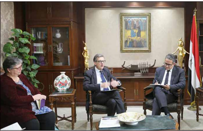
..ومع سفير المملكة المتحدة