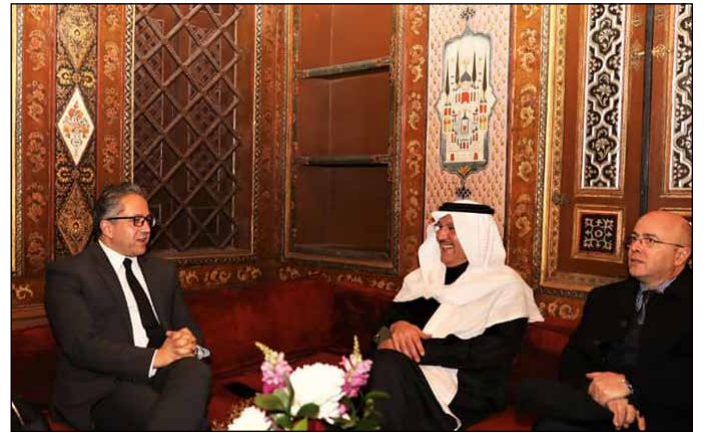
وزير السياحة والآثار مع سفير السعودية والمغرب

استقبل وزير السياحة والآثار خلال شهر فبراير عددًا من سفراء الدول الأجنبية والعربية، منها: فرنسا، المملكة المتحدة، اليابان، سنغافورة، بيلاروسيا، كازاخستان، اليونان، قبرص، أيرلندا، وذلك لمناقشة أوجه التعاون بين بلادهم ومصر في المجالات المختلفة بقطاعي السياحة والآثار، وتنشيط السياحة من تلك الدول إلى مصر، ووفد مجموعة الصداقة الفرنسية المصرية بمجلس الشيوخ الفرنسي، ومدير المكتب الإقليمي لليونسكو. بمناسبة الاحتفال بيوم السياحة العربي التقى الوزير بعدد من سفراء الدول العربية ومنهم سفير المملكة العربية السعودية والمملكة المغربية بالإضافة إلى عدد من ممثلي السفارات العربية، ومجموعة من الإعلاميين العرب، وذلك في حفل عشاء نظّمته الوزارة بالقاعة الذهبية بقصر الأمير محمد على بالمنيل.