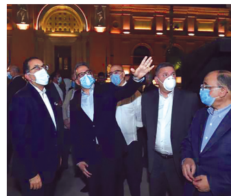
رئيس مجلس الوزراء يتفقد ميدان التحرير ص ٤