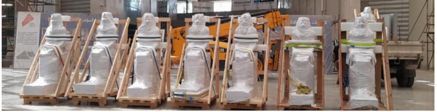
تماثيل الملك سنوسرت الأول

استقبل المتحف المصري الكبير ٣٤٦ قطعة أثرية من المتحف المصري بالتحرير من أهمها التماثيل العشرة الخاصة بالملك سنوسرت الأول من الأسرة الثانية عشر حيث وضعت تماثيله داخل البهو العظيم تمهيداً لوضعها في مكان عرضها الدائم بالمتحف، وفي سياق متصل استقبل أيضاً المتحف المصري الكبير ٤٢ قطعة خشبية من مركب خوفو الثانية وذلك بعد استخراجها من الحفرة الخاصة بها بالقرب من هرم الملك خوفو بمنطقة أهرامات الجيزة، حيث خضعت لأعمال الترميم بالمعمل الأثري الموجود بالموقع. وعلى صعيد آخر وفي إطار استمرار أعمال التقييم والتطهير التي تقوم بها وزارة السياحة والآثار ضمن الإجراءات الاحترازية للوقاية من فيروس كورونا المستجد، استمر المتحف المصري الكبير بميدان الرماية بأعمال تعقيم وتطهير المواقع الإنشائي للمتحف بالكامل.