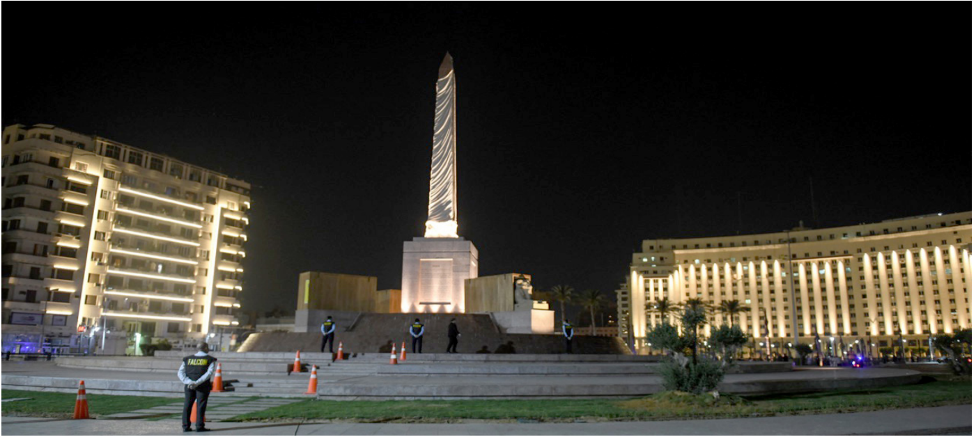
جانب من أعمال تطوير ميدان التحرير

انتهت بنجاح خلال شهر مايو عملية نقل الكباش الأربعة الى ميدان التحرير بوسط القاهرة وذلك بعد الانتهاء من أعمال ترميمها والتي امتدت على مدار الأشهر القليلة الماضية، وتم وضع الكباش الأربعة حول مسلة الملك رمسيس الثاني التي تم ترميمها وإقامتها بالميدان، وقد تم تغليف الكباش بصناديق خشبية لحين افتتاح مشروع تطوير ميدان التحرير.