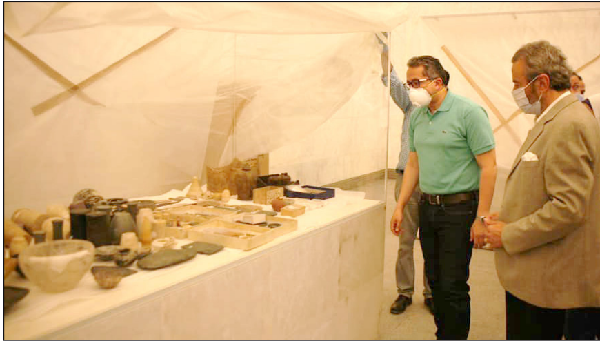
وزير السياحة والآثار داخل إحدى قاعات العرض بالمتحف القومي للحضارة المصرية

تفقد وزير السياحة والآثار، القاعات المختلفة للمتحف القومي للحضارة المصرية بالفسطاط، وذلك للوقوف على مستجدات الأعمال بالمشروع وخطة العمل به خلال الفترة الحالية تمهيداً لافتتاحه قريباً.