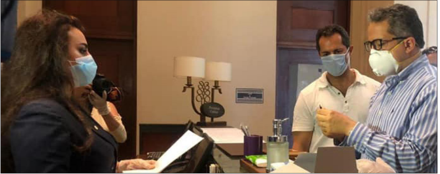
الوزير خلال تفقده أحد الفنادق

قام وزير السياحة والآثار خلال شهر مايو بزيارة محافظتي جنوب سيناء والبحر الأحمر، وذلك لمتابعة تطبيق الفنادق للضوابط التي اعتمدها مجلس الوزراء للسماح للفنادق باستقبال النزلاء المصريين بها بنسبة إشغال ٢٥ ٪ من طاقتها الاستيعابية، وذلك وفقًا لمعايير منظمة الصحة العالمية. ففي محافظة جنوب سيناء تفقد الوزير ومحافظ جنوب سيناء عددًا من فنادق شرم الشيخ، كما التقى بمجموعة من المستثمرين السياحيين بالمحافظة، وقام بجولة في مطار شرم الشيخ الدولي ومستشفى شرم الشيخ العام، ومشروع متحف آثار شرم الشيخ. كما قام الوزير بجولة أخرى في محافظة البحر الأحمر التقى خلالها بمحافظ البحر الأحمر، ومجموعة من المستثمرين السياحيين بالمحافظة، لمناقشة آخر تطورات عودة النشاط السياحي لفنادق المحافظة، وتضمنت الزيارة جولة للوزير داخل العيادات الطبية بالفنادق. كما قام الوزير بزيارة مشروع مدينة الجلالة بدعوة من الهيئة الهندسية للقوات المسلحة وذلك بمصاحبة المدير التنفيذي للمشروع.