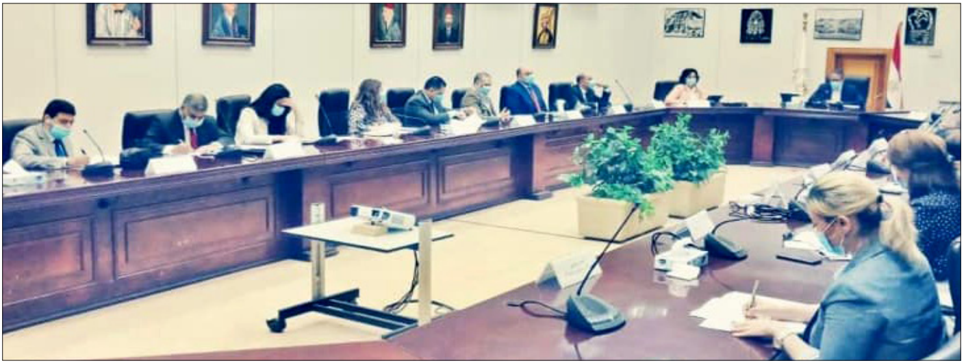
الوزير خلال اجتماع لجنة الأزمات

ترأس وزير السياحة والآثار خلال شهر مايو الاجتماع الرابع للجنة الأزمات والمخاطر بقطاع السياحة والتي أنشئت في أعقاب أزمة فيروس كورونا المستجد، تضم اللجنة نائب الوزير لشئون السياحة ورئيس الاتحاد المصري للغرف السياحية ورؤساء الغرف السياحية وممثلين من وزارة الإعلام ومجلس الوزراء والجهات الرقابية والأمنية وعدد من قيادات وزارة السياحة والآثار، وقد أشاد الوزير خلال الاجتماع بالجهود المبذولة من الوزارة وغرفة المنشآت الفندقية في متابعة الإجراءات الوقائية للفنادق التي تقدمت بطلبات من أجل السماح لها باستقبال الزائرين، كما وجه بتكثيف عمليات التفتيش للانتهاء من طلبات الفنادق التي ترغب في التشغيل في إجازة عيد الفطر (٢٤-٢٦ مايو) حال استيفائها للاشتراطات. وأشار الوزير إلى إشادة بعض الجهات الأجنبية من سفراء ومنظمي الرحلات بضوابط السلامة الصحية التي أقرتها الحكومة المصرية، والذين أكدوا على أن مصر من أهم المقاصد السياحية في فترة ما بعد الكورونا.