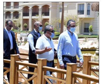
جولات لوزير السياحة والآثار في بعض المحافظات السياحية ص ٢