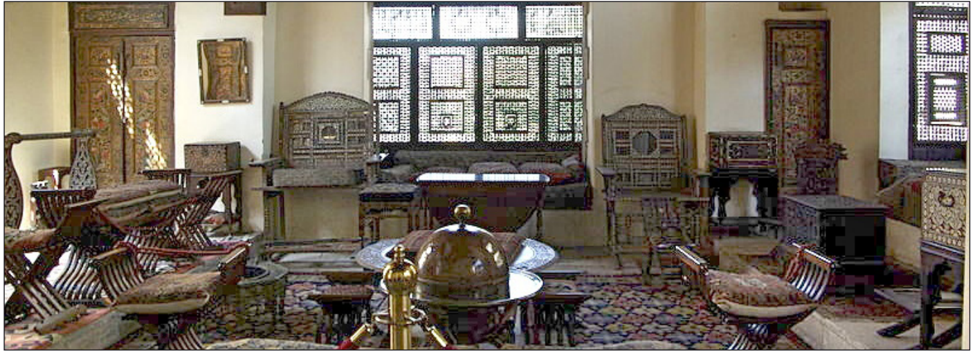
إحدى قاعات متحف جابر أندرسون بالقاهرة

أطلقت وزارة السياحة والآثار عدداً من الزيارات الإرشادية لعرض وشرح عدد من القطع الأثرية الإسلامية الفريدة والنادرة من داخل متحف الفن الإسلامي بباب الخلق، وذلك على كافة مواقع الانترنت ومواقع التواصل الاجتماعي الخاصة بها، كما أطلقت الوزارة عدداً من الجولات الافتراضية لعدد من المواقع الأثرية الإسلامية منها جامع محمد علي بقلعة صلاح الدين الأيوبي، ومسجد الفتح الملكي بمنطقة عابدين، ومتحف جابر أندرسون أو ما يعرف ببيت الكريتلية وغيرها.