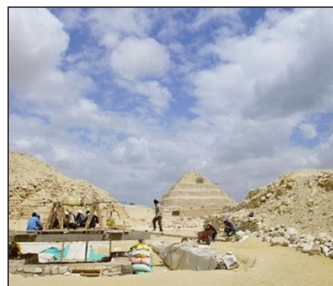
اكتشافات جديدة بورشه التحنيط بسقارة ص ٦