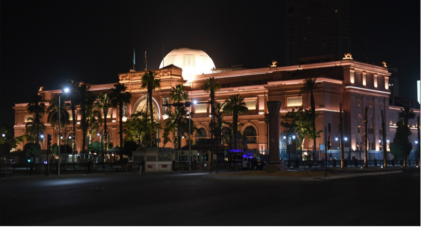
المتحف المصري بالتحرير

وجه وزير السياحة والآثار كلمة للعالم يوم ١٨ مايو من أمام المتحف المصري بالتحرير، وذلك بمناسبة اليوم العالمي للمتاحف، أوضح خلالها الاستعدادات التي تتم بالمتاحف لاستقبال الزائرين عند فتحها مرة أخرى أمام الجمهور وعلى رأسها المتحف المصري بالتحرير (حيث كانت الوزارة قد أصدرت في مارس الماضي قرارًا بغلاق المتاحف والمواقع الأثرية لمواجهة انتشار فيروس كورونا المستجد)، كما أطلقت الوزارة بهذه المناسبة عددًا من الأفلام على مواقع التواصل الاجتماعي لتسليط الضوء على المتاحف المصرية وإبراز دورها الثقافي في مصر والعالم.