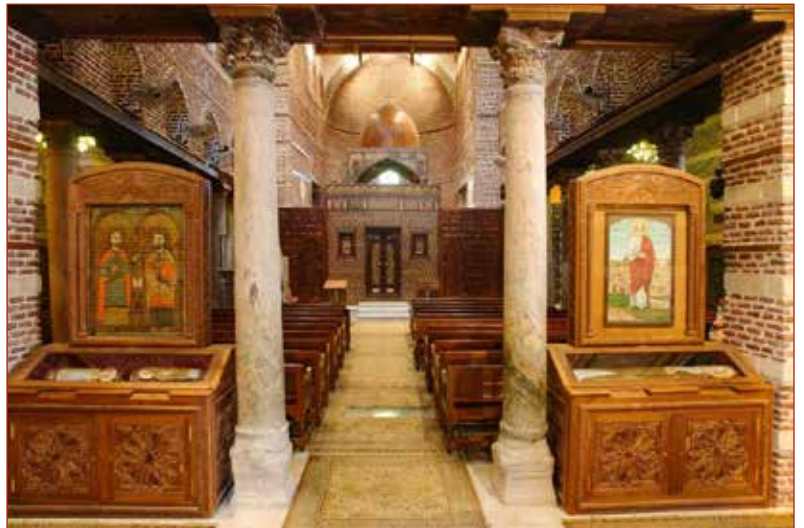
داخل كنيسة أبي سرجة

احتفلت وزارة السياحة والآثار بذكرى دخول العائلة المقدسة إلى مصر والذي يوافق الأول من يونيو في كل عام، وذلك باطلاق جولة افتراضية بكنيسة القديسين سرجيوس وباخوس المعروفة باسم كنيسة أبي سرجه. وترتبط هذه الكنيسة بمسار رحلة العائلة المقدسة في مصر والذي ارتبط بأكثر من ٢٥ بقعة في ربوع مصر المختلفة من ساحل سيناء شرقاً إلى دلتا النيل حتى وصلت إلى أقصى صعيد مصر.