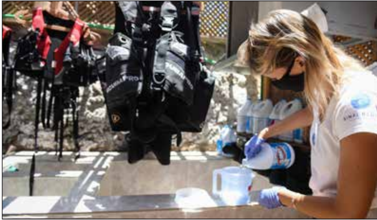
تعقيم أدوات الغوص بإحدى المراكز الحاصلة على الشهادة

حصل ٣٠٥ مطعمًا وكافيتريا سياحية على شهادة السلامة الصحية لإعادة التشغيل، وذلك بعد التأكد من استيفائهم لكافة الضوابط والاشتراطات التي أصدرتها وزارة السياحة والآثار، حيث تم السماح بإعادة تشغيل المنشآت السياحية المكشوفة والمغلقة بنسبة ٢٥ ٪ من حجم الطاقة الاستيعابية للمنشأة اعتباراً من ٢٧ يونيو ٢٠٢٠.