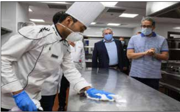
وزير السياحة والآثار يتفقد أحد الفنادق

في ظل استعدادات استئناف السياحة الوافدة للمحافظات السياحية الساحلية اعتباراً من أول يوليو ٢٠٢٠، اصطحب وزير السياحة والآثار، في زيارات نظمتها الهيئة المصرية العامة لتنشيط السياحي، وفد من الإعلام المصري والأجنبي في زيارات تعريفية لعدد من المحافظات السياحية وهي البحر الأحمر وجنوب سيناء والأسكندرية ومطروح، وذلك لإطلاعهم على كافة الضوابط والإجراءات الاحترازية المتبعة في كافة المناطق التي ستستقبل السائحين ومنها المطارات، والفنادق، والعيادات والمستشفيات، ومراكز الغوص، بالإضافة لبعض المناطق الأثرية والمتاحف.