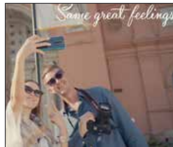
الوزارة تطلق فيلم "رحلة سائح في مصر" ص ٤