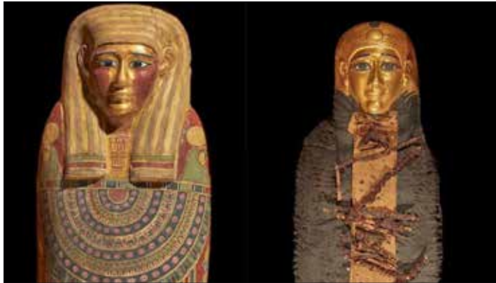
عدد من القطع التي استقبلها متحف المطار

استقبل متحف مطار القاهرة الدولي بصالة (٣) مجموعة من القطع الأثرية بلغ عددها ١٢ قطعة تم اختيارها من قبل اللجنة العليا لسيناريوهات المتاحف لإثراء العرض المتحفي، وهذه القطع قادمة من مخازن كل من المتحف المصري بالتحرير ومتحف السويس القومي تمهيداً لافتتاحه الوشيك.