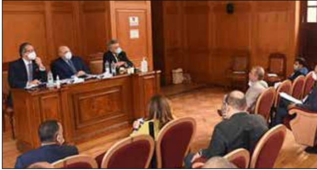
وزير السياحة والآثار في البرلمان

حضر وزير السياحة والآثار في ٧ يونيو ٢٠٢٠ اجتماع اللجنة البرلمانية المشتركة من لجان الإعلام والثقافة والآثار، ولجنة السياحة والطيران المدني، ولجنة الخطة والموازنة، لمناقشة مشروع قانون صندوق السياحة والآثار. يهدف مشروع القانون إلى دعم وتمويل الأنشطة التي تعمل على تنمية وتنشيط السياحة والترويج لها عالمياً، وتطوير الخدمات بالمناطق السياحية وتحفيز السياحة الوافدة، ومشروعات ترميم وحفظ وصيانة الآثار. وقد وافق أعضاء اللجان بصورة مبدئية على مشروع قانون صندوق السياحة والآثار مع اجراء بعض التعديلات على بعض البنود والصياغات الخاصة بمصادر التمويل.