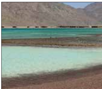
رحلة إلى رمال الذهب ص ٨

تم البدء في مشروع ترميم قصر البارون في نهاية عام ٢٠١٧ حيث تم إسناد الأعمال إلى الهيئة الهندسية بالقوات المسلحة، وشركات وطنية مثل شركة المقاولون العرب، تحت إشراف المختصين من خبراء واستشاريين في مجالات الترميم والآثار والعمارة والإنشاءات، وذلك بتكلفة قدرها ١٧٥ مليون جنيه من ضمنها مساهمة من الحكومة البلجيكية بمبلغ ١٦ مليون جنيه. استغرق هذا المشروع حوالي عامين من العمل الجاد بعد عشرات السنوات من الإهمال. القصر أنشأه رجل الصناعة البلجيكي البارون إدوارد إيمان واستمر بناؤه خمسة أعوام من ١٩٠٧ حتى ١٩١١، واستوحى تصميمه المهندس الفرنسي Alexandre Marcel من طراز المعابد الكمبودية.