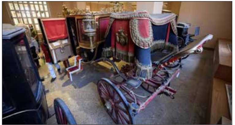
جانب من متحف المركبات الملكية

خلال اجتماع لمجلس إدارة المجلس الأعلى للآثار برئاسة وزير السياحة والآثار، استعرض الأمين العام للمجلس الأعلى للآثار خطة الافتتاحات الأثرية خلال الفترة القادمة حيث تضم متاحف كل من العاصمة الإدارية الجديدة وشم الشيخ وكفر الشيخ والمركبات الملكية ببولاق والمتحف القومي للحضارة المصرية بالفسطاط ومطار القاهرة.