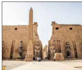
قرارات المجلس الأعلى للآثار لتشجيع السياحة الثقافية ص ٦