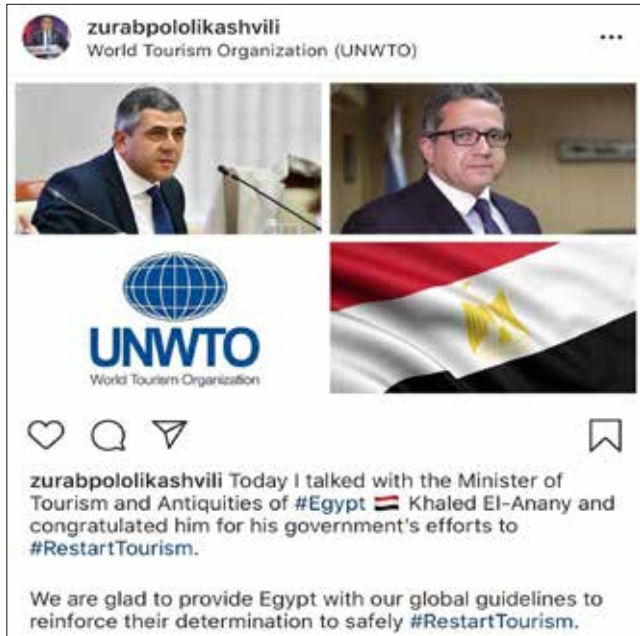
تغريدة الأمين العام لمنظمة السياحة العالمية على تويتر

أجرى وزير السياحة والآثار اتصالاً، عبر الفيديو كونفرانس، مع الأمين العام لمنظمة السياحة العالمية التابعة للأمم المتحدة (UNWTO)، وخلال اللقاء تم استعراض ضوابط السلامة الصحية التي أصدرتها الوزارة لتشغيل المنشآت الفندقية والسياحية والأنشطة السياحية والمواقع الأثرية والمتاحف استعداداً لاستئناف حركة السياحة الوافدة.