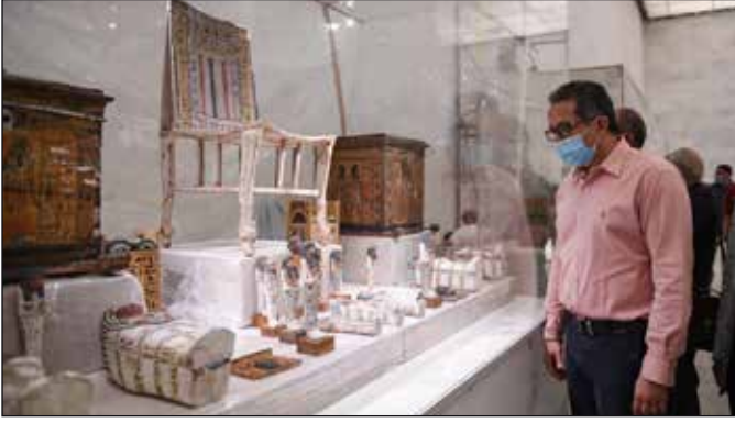
وزير السياحة والآثار داخل إحدى قاعات المتحف القومي للحضارة المصرية

تفقد وزير السياحة والآثار مستجدات الأعمال بقاعة العرض المركزية بالمتحف القومي للحضارة المصرية بالفسطاط، وذلك للوقوف على آخر تطورات سيناريو العرض المتحفي بها تمهيداً للافتتاح الوشيك. وبعد الانتهاء من الجولة، اجتمع الوزير بأثريي ومرممي المتحف وأعضاء اللجنة العليا لسيناريو العرض المتحفي؛ حيث تم مناقشة الاستعدادات الجارية لعملية نقل المومياءات الملكية من المتحف المصري بالتحرير في موكب ملكي ضخم وطريقة عرضها داخل القاعة المخصصة لها بالمتحف.