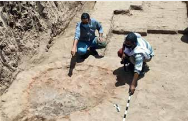
جانب من الأفران المكتشفة

كشفت البعثة الأثرية المصرية أثناء أعمال مشروع ترميم وإحياء طريق الموابك الكبرى المعروف باسم طريق الكباش، عن عدد من أفران للحرق دائرية الشكل من الطوب اللبن عليها آثار حرق، ربما كانت تستخدم في تصنيع الفخار أو الفينانس، كما تم الكشف عن سور ضخم من الطوب اللبن من العصر الروماني والمتأخر غرب طريق الموابك الخاص بمعبد خونسو. وعثرت البعثة أيضاً على جدار تم بناؤه من كتل الحجر الرملي، وهو امتداد للجدار الذي كان يجمي الضفة الشرقية للنيل من تغير مناسيب نهر النيل. والتزم فريق العمل باتخاذ كافة تدابير الوقاية والحماية اللازمة من فيروس كورونا المستجد، أثناء الأعمال وذلك بارتداء الكمامات واتخاذ مسافات التباعد بين الأشخاص أثناء القيام بأعمال الحفر.