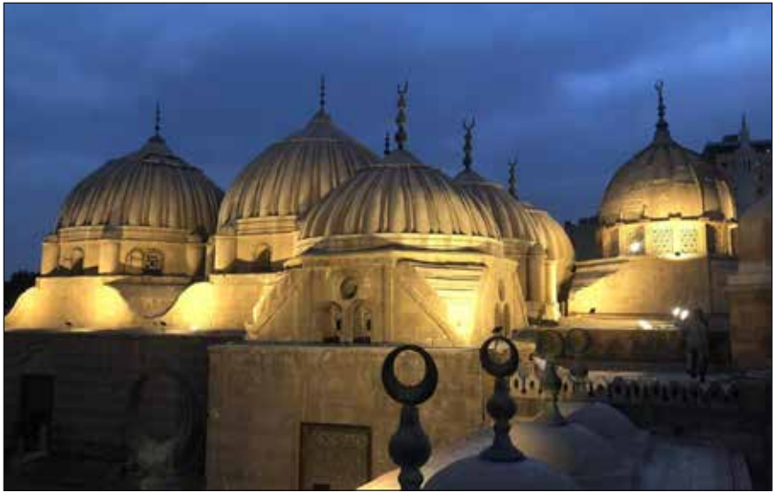
قباب الأسرة العلوية

جدير بالذكر أن هذه المقابر والمعروفة باسم حوش الباشا تقع بمنطقة الامام الشافعي، وقام بنائها محمد علي كمدفن له ولعائلته في عام ١٨١٦م، ولكنه لم يدفن بها ودُفن بمسجده بقلعة صلاح الدين.