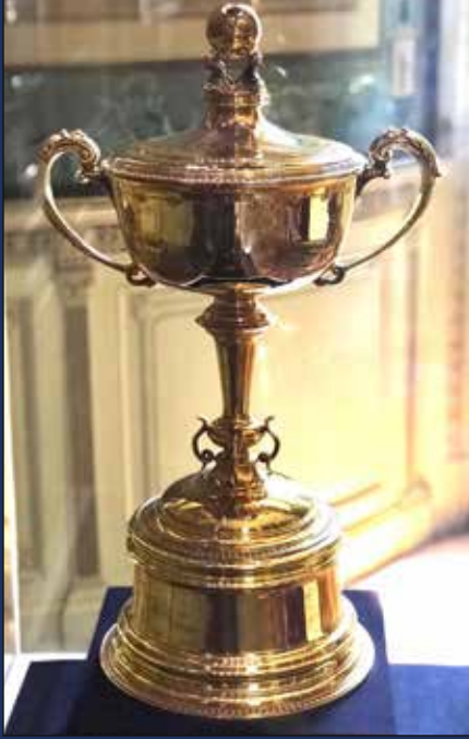
كأس الملك فؤاد