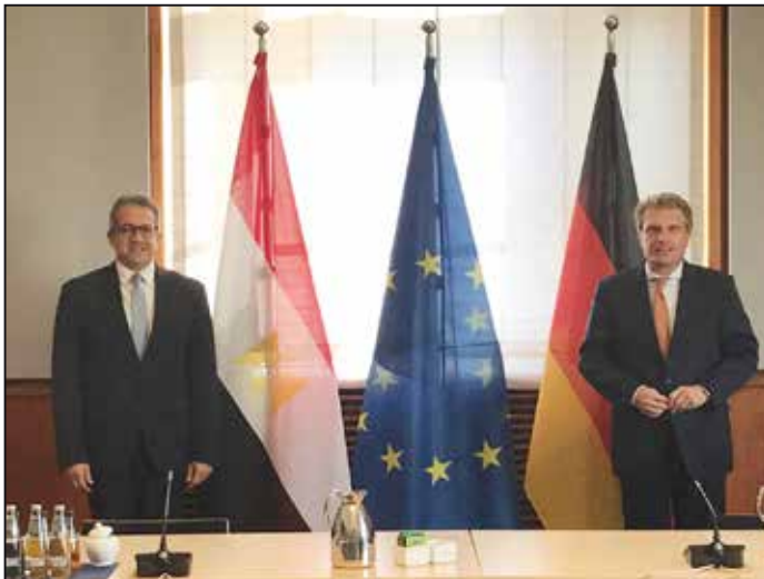
لقاء الوزير مع وزير الدولة لشئون السياحة في ألمانيا

توجه الوزير، في ١٨ سبتمبر، بعد انتهاء زيارته للعاصمة الجورجية تبليسي، في زيارة قصيرة إلى العاصمة الألمانية برلين وهي أول زيارة لمسئول مصري إلى دولة ألمانيا بعد أزمة فيروس كورونا المستجد. جاءت هذه الزيارة في إطار الجهود المكثفة لاستئناف حركة السياحة الألمانية الوافدة إلى المقاصد السياحية المصرية، وبالتنسيق الكامل مع سفارة مصر بألمانيا، حيث تم إعداد برنامج مكثف ومتنوع للوزير يتضمن عدد من اللقاءات الرسمية والمهنية منها لقاء وزير الدولة لشئون السياحة، ووزير الدولة للشئون الخارجية في ألمانيا، ورئيس لجنة أزمة الكورونا في ألمانيا، ورئيس لجنة السياحة بمجلس النواب الألماني، بالإضافة إلى مشاركة الوزير في مؤتمر صحفي حضره عدد من ممثلي وكالات الأنباء والصحف والقنوات التلفزيونية الألمانية.