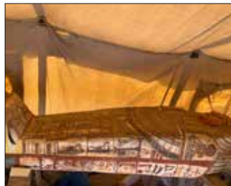
كشف أثري جديد بمنطقة سقارة ص ٩