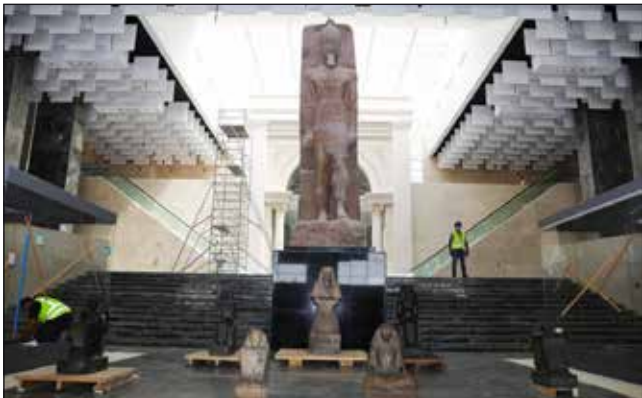
متحف العاصمة الإدارية الجديدة

تفقد الوزير، يومي ٢٠ و ٢٨ سبتمبر، متحف العاصمة الإدارية الجديدة المتابعة مستجدات سير الأعمال به تمهيداً لافتتاحه قريباً، وتم التوجيه بإضافة المزيد من القطع الأثرية من مختلف العصور المصرية القديمة والقبطية والإسلامية لإثراء سيناريو العرض المتحفي ليكون جديراً بوجوده في العاصمة الإدارية الجديدة ذلك الكيان السياسي، الاقتصادي، الثقافي الكبير.