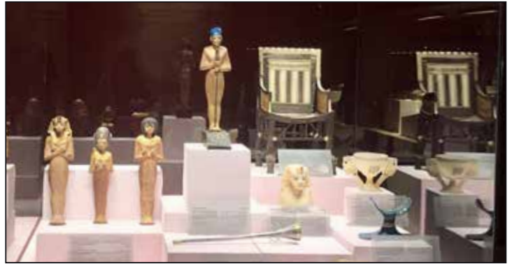
قطع أثرية للملك توت عنخ آمون بمتحف الغردقة العرض بالمتحف وهي عبارة عن مجموعة من التوابيت الملونة، بالإضافة إلى ١٠٠٠ تماثيل أوشابتي، وقام بزيارة متحف التحنيط للوقوف على الأنشطة التدريبية بالمتحف ضمن برنامج "سفراء السياحة" لتأهيل جميع المتعاملين مع السائح في المواقع الأثرية. ثم توجه بعد ذلك إلى مدينة الغردقة، لتفقد المعرض المؤقت لبعض كنوز الملك توت عنخ آمون التي تعرض لأول مرة بمتحف الغردقة.

كما تفقد الوزير القطع الأثرية التي استقبلها متحف الأقصر من منطقة آثار تونة الجبل والمتحف المصري بالتحريم لتتضم إلى سيناريو الأنشطة التدريبية بالمتحف ضمن برنامج "سفراء السياحة" لتأهيل جميع المتعاملين مع السائح في المواقع الأثرية. ثم توجه بعد ذلك إلى مدينة الغردقة، لتفقد المعرض المؤقت لبعض كنوز الملك توت عنخ آمون التي تعرض لأول مرة بمتحف الغردقة.