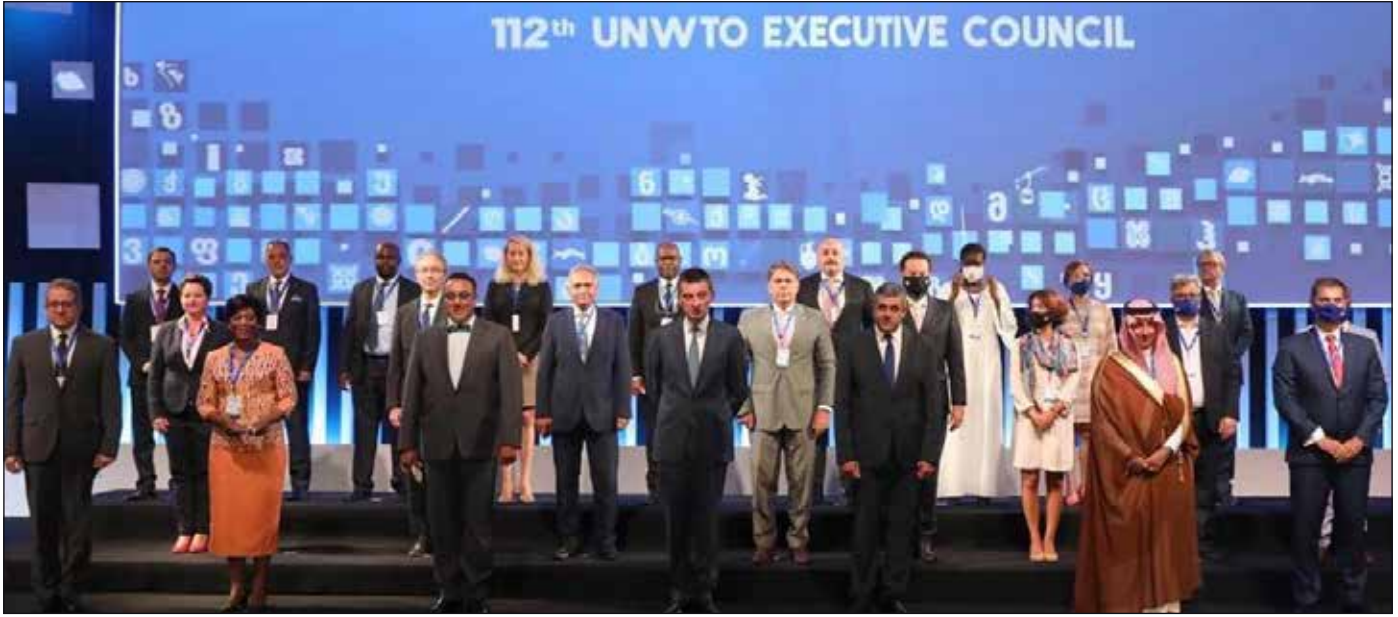
افتتاح الدورة ال ١١٢ للمجلس التنفيذي للمنظمة

شارك الوزير في فعاليات الدورة ال ١١٢ للمجلس التنفيذي لمنظمة السياحة العالمية بالعاصمة الجورجية تبليسي، وفي الجلسة الافتتاحية للمجلس يوم ١٦ سبتمبر، وذلك بحضور رئيس وزراء جورجيا و١٧٠ وزيراً ومسئولاً عن قطاع السياحة في ٢٤ دولة، بالإضافة إلى مشاركة من باقي دول العالم عبر الفيديو كونفرنس.