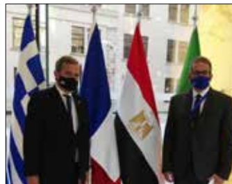
جولات للوزير في عدد من الدول الأوروبية ص ٣