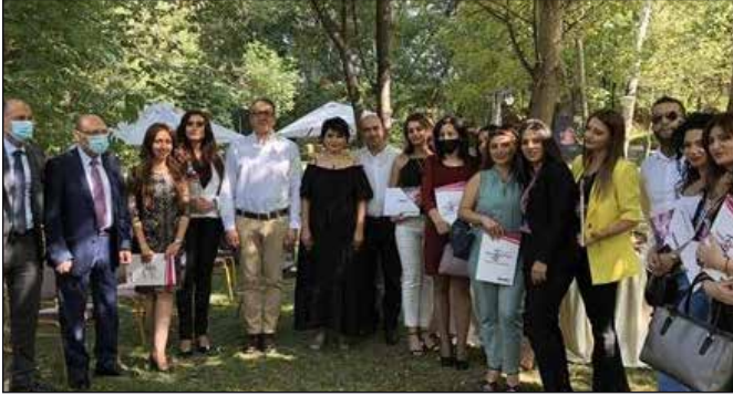
لقاء الوزير مع مسؤولي كبرى منظمي الرحلات والشركات السياحية في أرمينيا

في زيارة قصيرة للعاصمة الأرمنية يريفان، يوم ١٥ سبتمبر، قام سفير جمهورية مصر العربية بأرمينيا بتنظيم لقاء للوزير مع أكثر من ٣٠ من مسؤولي كبرى منظمي الرحلات والشركات السياحية في أرمينيا، وبحضور ممثلي وسائل الإعلام ووكالات الأنباء، وقد جاءت هذه الزيارة في ضوء استئناف رحلات الطيران بين أرمينيا ومصر اعتباراً من ١٧ سبتمبر. ومن جانبهم، أشاد منظمي الرحلات والشركات السياحية بالتدابير الاحترازية وضوابط السلامة الصحية التي اتخذتها الحكومة المصرية لاستئناف الحركة السياحية بها، وايضا بالتسهيلات التي تقدمها الحكومة المصرية لهم لتشجيع الحركة السياحية إليها، مؤكداً أن مصر أصبحت الوجهة السياحية الأولى بالنسبة للمواطنين الأرمن.