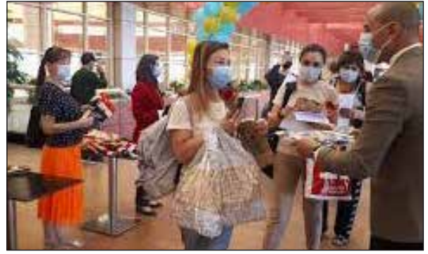
وصول أولى رحلات الطيران من كازاخستان

استقبلت مدينة شرم الشيخ، يوم ١٤ سبتمبر، أولى رحلات الطيران القادمة من دولة كازاخستان وعلى متنها ٢٣٩ سائحاً، كما استقبلت المدينة يوم ١٧ سبتمبر، أولى رحلات الطيران من دولة أرمينيا والتي جاء على متنها ٧٠ سائحاً، من بينهم ١٠ من ممثلي وسائل الإعلام السياحي بأرمينيا. وقد قام مكتب الهيئة المصرية العامة للتنشيط السياحي بمدينة شرم الشيخ باستقبال الرحلتين وتقديم كافة التسهيلات والهدايا التذكارية لهم.