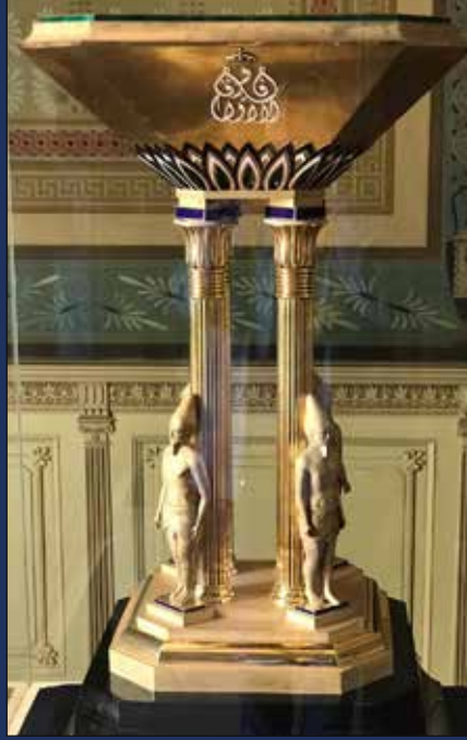
كأس الملك فاروق

يحتفل العالم في ٢٧ سبتمبر من كل عام بيوم السياحة العالمي والذي يتزامن مع الذكرى السنوية لاعتقاد النظام الأساسي لمنظمة السياحة العالمية في مثل هذا اليوم عام ١٩٧٠، ويتزامن هذا التاريخ مع ذكرى اليوم الذي قام فيه العالم الفرنسي جان فرانسوا شامبلون بفك رموز اللغة الهيروغليفية بشكل رسمي.