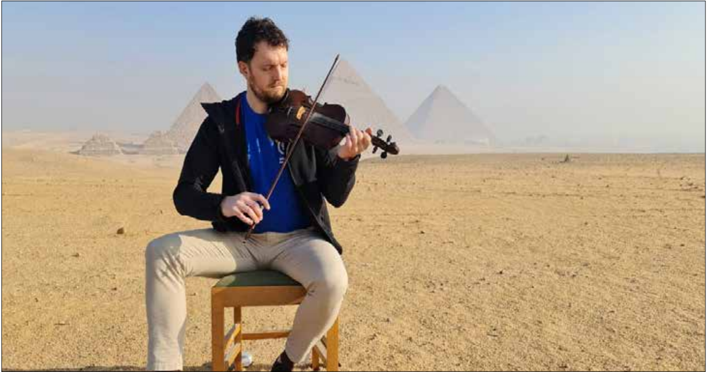
العازف الأيرلندي أمام الأهرامات

اختارت سفارة أيرلندا بالقاهرة منطقة أهرامات الجيزة للاحتفال بالعيد القومي لدولة أيرلندا، حيث قامت السفارة بتصوير فيلم قصير لعرض موسيقي من التراث الأيرلندي عزفه أحد العازفين الأيرلنديين أمام الأهرامات، وذلك بحضور سفير دولة أيرلندا في القاهرة، وقامت السفارة بنشر هذا الفيلم في برنامج خاص تم إذاعته على التلفزيون الوطني الأيرلندي يوم ١٧ مارس، كما تم نشره على الإنترنت ليشاهده ٧٠ مليون مواطن أيرلندي حول العالم.