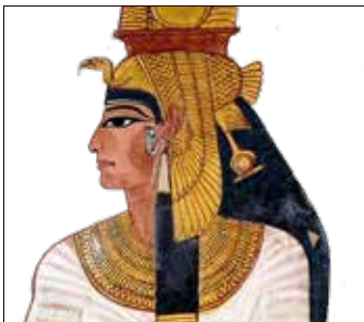
المرأة في مصر القديمة