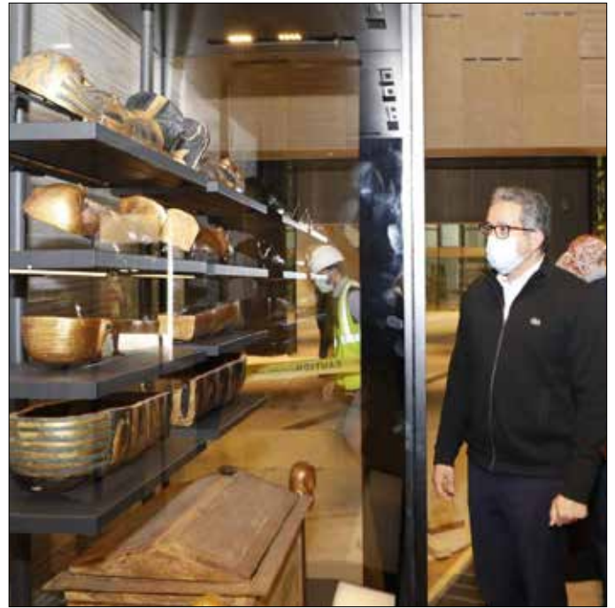
جانب من جولة الوزير

قام الوزير يوم ٧ مارس، بجولة تفقدية بالمتحف لمتابعة مستجدات الأعمال به، وذلك برفقة المشرف العام على مشروع المتحف والمنطقة المحيطة به، والأمين العام للمجلس الأعلى للآثار، ومساعد الوزير للشئون الأثرية بالمتحف. وقد شهد الوزير قيام الأثريين والمرممين بوضع أوائل القطع الأثرية لكنوز الملك توت عنخ آمون في فتارين العرض الخاصة بها وذلك وسط إجراءات أمنية مشددة.