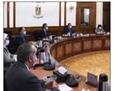
رئيس الوزراء يترأس اجتماع اللجنة الوزارية للسياحة والآثار