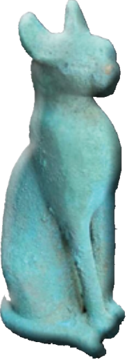
القطعة الأثرية المستردة

عادت إلى مصر يوم ١٥ مارس القطع الأثرية الخاصة بمعرض "أسرار مصر الغارقة" وذلك بعد انتهاء جولة المعرض الخارجية بالولايات المتحدة الأمريكية والتي زار خلالها أربعة مدن أمريكية، بالإضافة إلى جولته في عدد من الدول الأوروبية بداية من فرنسا ثم إنجلترا وسويسرا، حيث حقق هذا المعرض نجاحاً كبيراً في جميع المدن التي أُقيم بها، حيث كان قائماً على فكرة عرض الآثار المصرية الغارقة التي تم اكتشافها بمدينة الإسكندرية تحت مياه البحر الأبيض المتوسط.