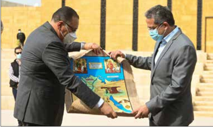
خلال افتتاح مشروع تطوير موقع تل بسطة بالشرقية

قام الوزير يوم ٢٢ مارس برفقة وزير التنمية المحلية ومحافظ الشرقية، بافتتاح مشروع تطوير موقع تل بسطة بالشرقية أحد نقاط مسار العائلة المقدسة والذي يحتوي على موقع البئر الذي مرت به العائلة المقدسة والذي يقع وسط منطقة أثرية تحيط بالبئر. وعلى هامش الزيارة افتتح الوزير معرض تراث مصر للحرف التراثية، الذي يأتي في إطار العمل على استراتيجية التنمية المستدامة مصر ٢٠٣٠، لتنمية الابتكار والإبداع للصناعات التقليدية والتراثية والسياحية، ودعم وتمكين رواد الأعمال من أرباب الحرف والمشروعات المتوسطة والصغيرة.