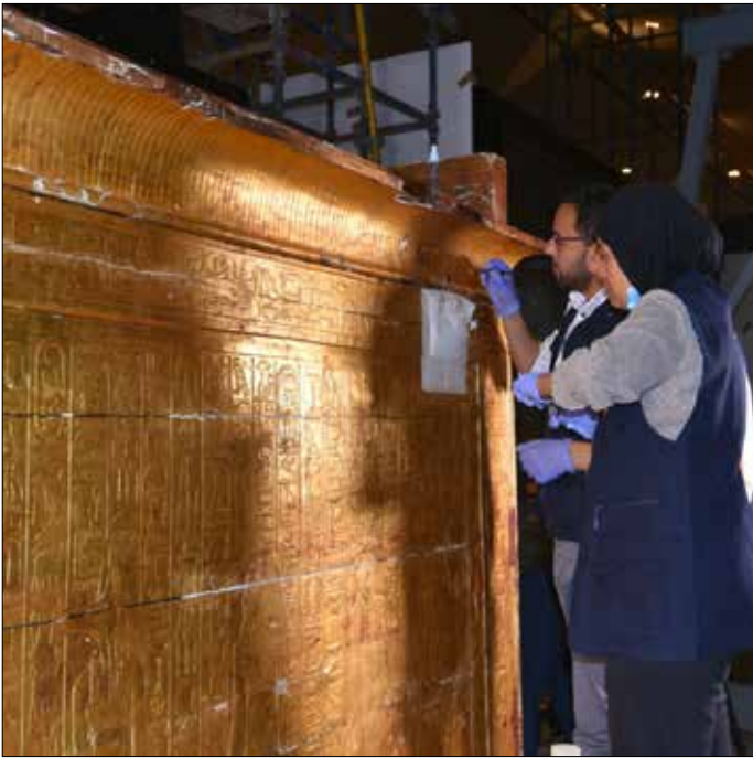
أثناء ترميم المقصورة