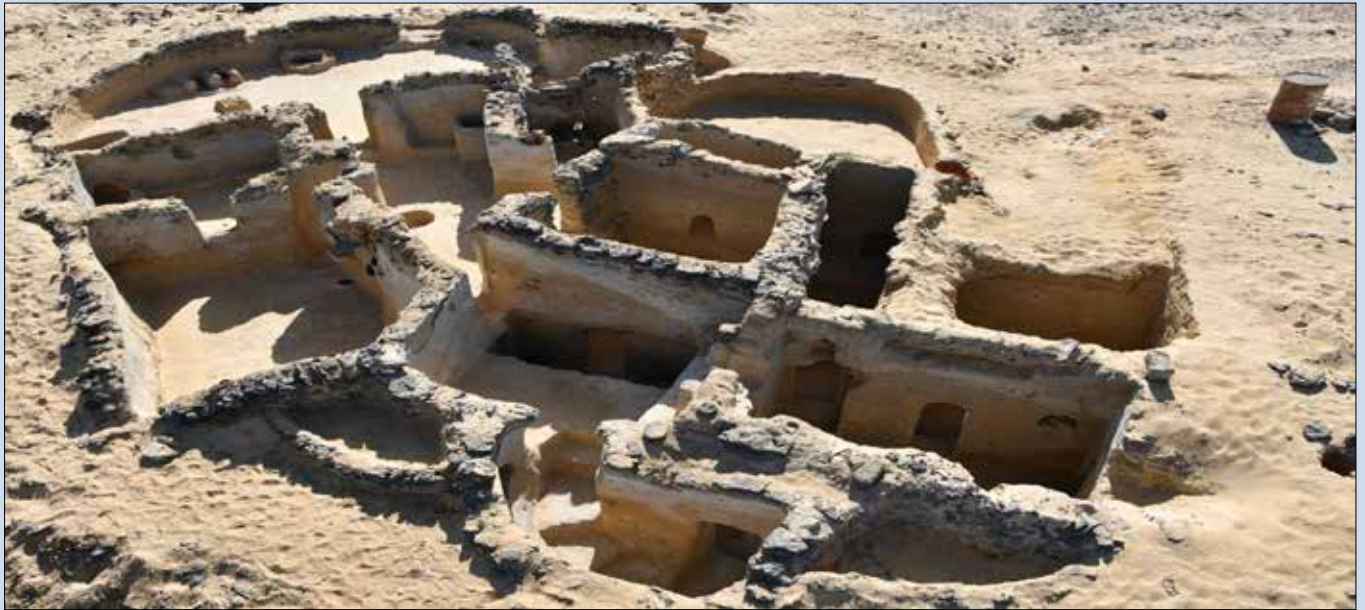
جانب من الكشف الأثري

كشفت البعثة الأثرية النرويجية الفرنسية العاملة بموقع تل جنوب قصر العجوز بالواحات البحرية في موسمها الثالث عن عدد من المباني المشيدة من حجر البازلت والمنحوتة في الصخر، ومباني مشيدة من الطوب اللبن ترجع إلى ما بين القرن الرابع والقرن السابع الميلادي وهي عبارة عن ست مناطق تتضمن بقايا ثلاث كنائس وقلالي للرهبان وتحمل الجدران مخربشات ورموز تحمل دلالات قبطية. وترجع أهمية هذا الكشف إلى مساعدته في معرفة تخطيط المباني وفهم تكوين التجمعات الرهبانية الأولى في مصر في هذه المنطقة.