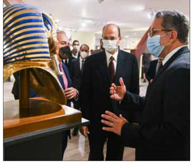
الوزير أثناء الافتتاح

افتتح الوزير يوم ٢٧ مارس مصنع المستنسخات الأثرية بمدينة العبور، والذي يعد الأول من نوعه في مصر والشرق الأوسط، وتم إنشائه بالتعاون مع شركة 'كنوز مصر للنماذج الأثرية'، حيث بدأت أعمال إنشائه منذ حوالي عام ونصف لمواكبة متطلبات السوق المحلي والعالمى في صناعة النماذج الأثرية، بالإضافة إلى أنه سيساهم في حماية التراث الحضاري والثقافي المصري وحماية حقوق الملكية الفكرية للآثار المصرية، حيث يحمل كل مستنسخ أثري يتم إنتاجه بالمصنع ختماً خاصاً بالمجلس الأعلى للآثار، وشهادة معتمدة تفيد بأنه قطعة مقلدة وصورة طبق الأصل وأنه من إنتاج الوزارة، إلى جانب وجود (باركود) يمكن من خلاله التعرف على كافة المعلومات الخاصة بهذه القطعة باللغتين العربية والإنجليزية. ويضم المصنع وحدات للإنتاج اليدوي وأتمتة، وقاعة للعرض، ويعمل به حوالي ١٥٠ من الفنانين والمهنيين ذوي خبرة وكفاءة عالية في المجال معظمهم من أبناء الوزارة. ومن المقرر أن يتم افتتاح أول منفذ بيع رسمي لهذه المستنسخات في المتحف القومي للحضارة المصرية اعتباراً من ٤ أبريل المقبل بعد افتتاح المتحف رسمياً، كما سيتم إتاحة منافذ بيع رسمية لهذه المستنسخات في كافة المحافظات والمتاحف والأسواق في القريب العاجل بما يساهم في تشجيع الصناعة المصرية.