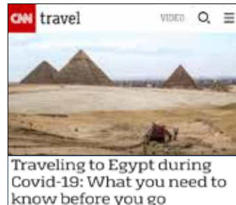
مصر في عيون العالم