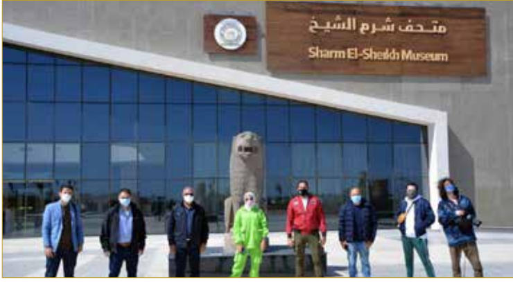
جانب من زيارة المدونين لمتحف شرم الشيخ

استكملت الأمانة العامة للهيئة المصرية العامة للتنشيط السياحي في تنظيم زيارات ورحلات تعريفية لمشاهير المدونين والمؤثرين الأجانب والعرب والمصريين، نظمت الهيئة خلال شهر مارس زيارة تعريفية إلى محافظة جنوب سيناء لعدد من المؤثرين المصريين الذين يتمتعون بعدد كبير من المتابعين على منصات التواصل الاجتماعي تراوح أعدادهم ما بين ٥٠٠ ألف واثني مليون متابع. وقد اصطحبهم خلال هذه الزيارة الرئيس التنفيذي للهيئة ورئيس قطاع الآثار الإسلامية والقبطية واليهودية بالمجلس الأعلى للآثار في جولة سياحية بمدينة شرم الشيخ وسانت كاترين.