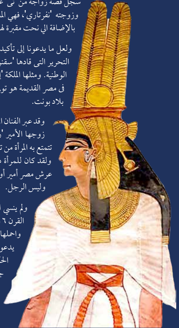
منظر للملكة نفرتاري من مقبرتها المميزة بوادي الملكات المقبرة رقم QV 66